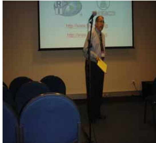
照片 2 筆者參加木材防火組演講一景