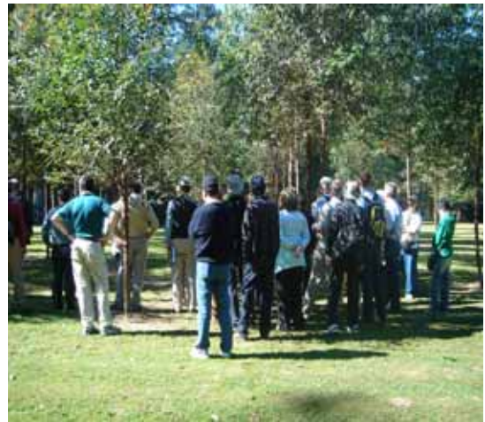
照片 5 筆者參觀澳國桉樹造林之一景 照片 6 筆者參觀澳國桉樹造林之一景