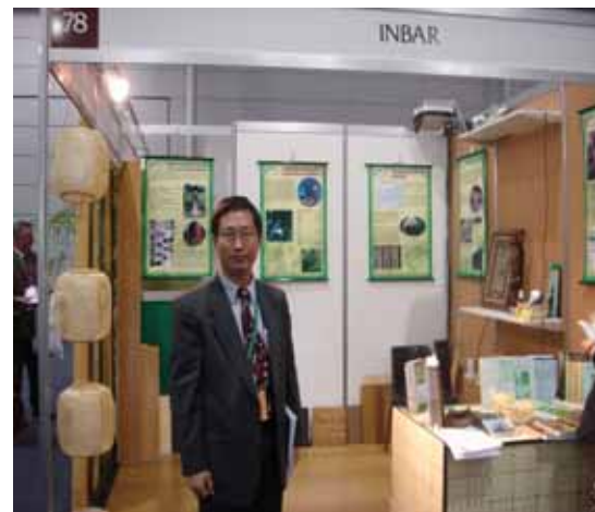
照片 4 筆者參觀展覽之一景