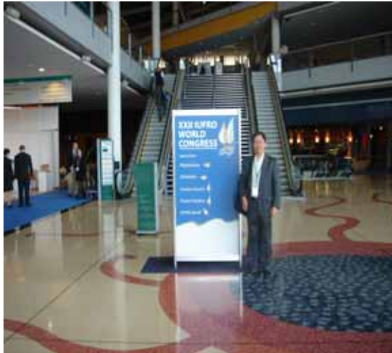
照片 1 筆者留影於會場