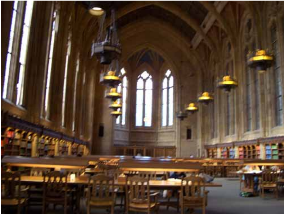
相片六、古色古香的高挑閱覽室