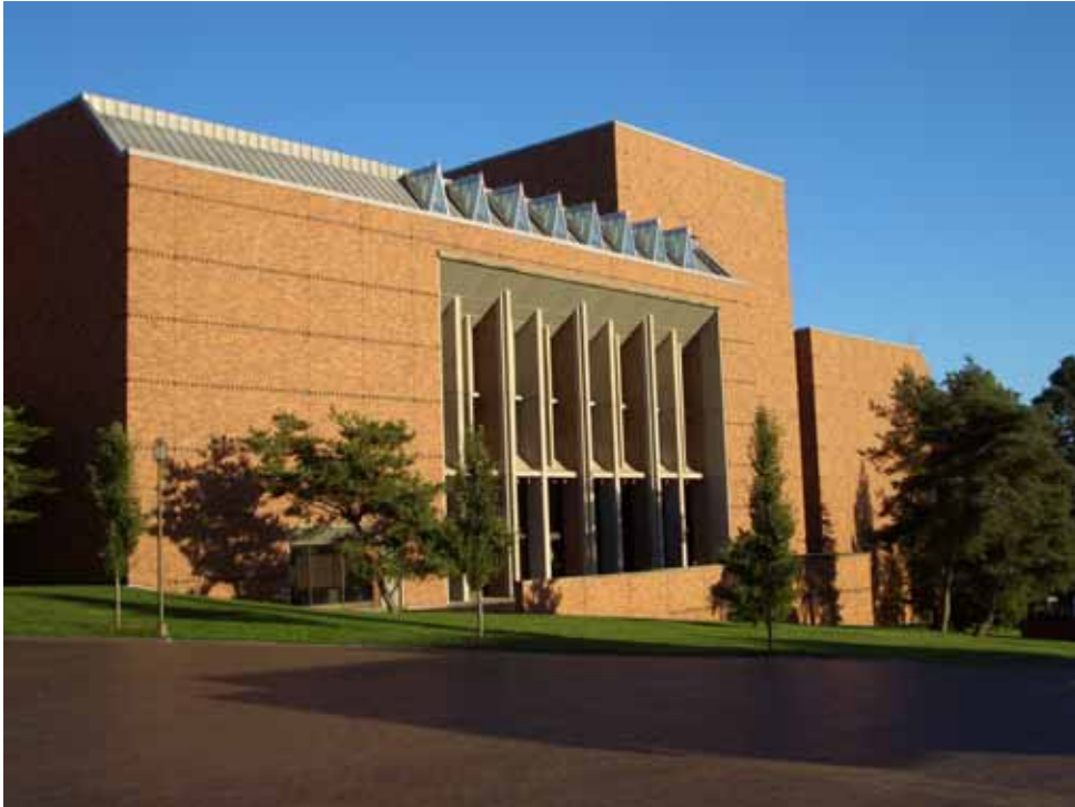
相片二之二、華盛頓大學之現代建築