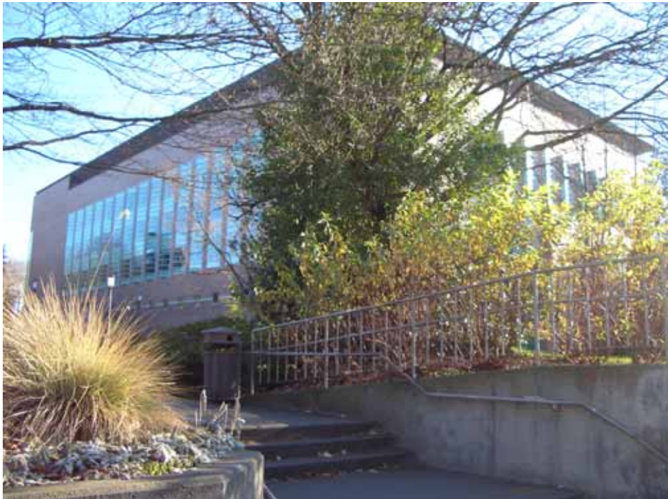
相片九之一、欄杆是為了避免摔跤而非禁止跨越