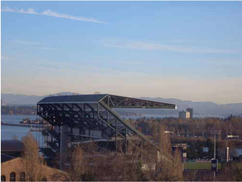
相片八、遠山近水高台