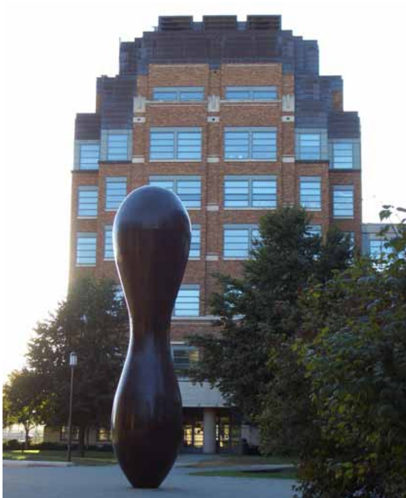
相片二、華盛頓大學之現代建築