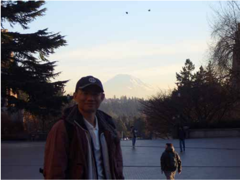
相片三、站在紅色廣場可遠眺雷尼爾山