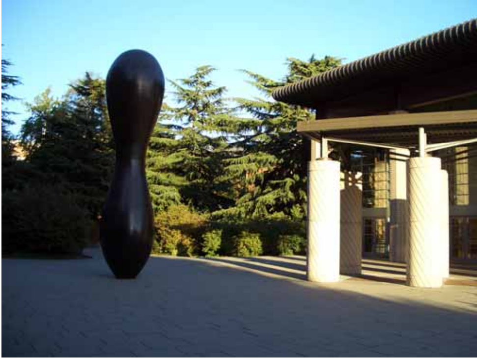
相片十二、剛柔並濟、屹立不搖