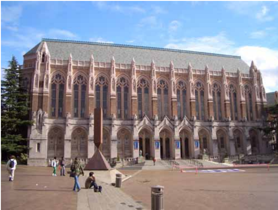
相片五、紅色廣場與 Suzzallo 圖書館