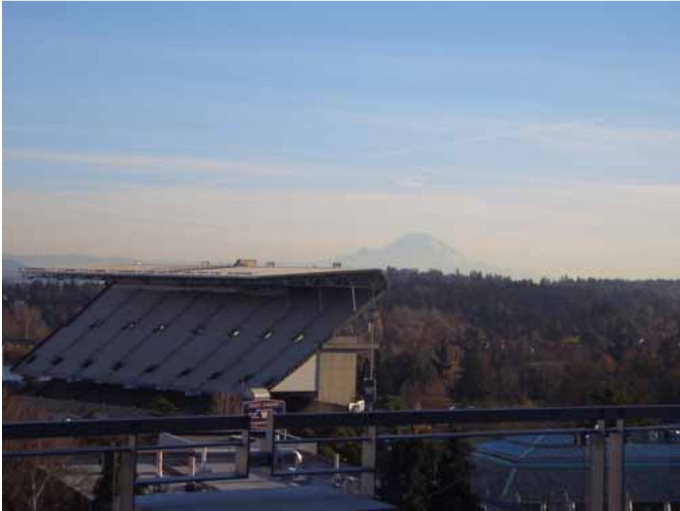
相片八之一、與山比高