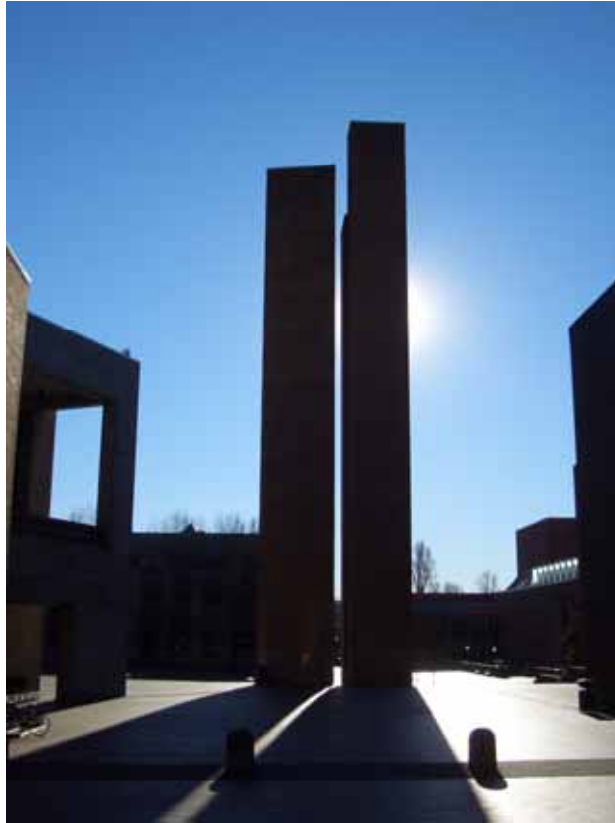
相片十二之二、高聳入雲、頂天立地