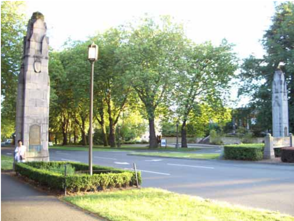
相片十、獨樹一格的校門