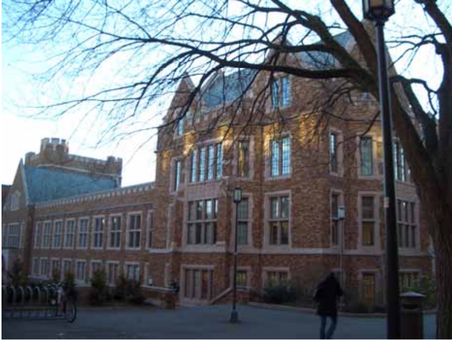
相片一、華盛頓大學之哥德式建築