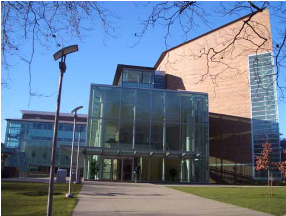
相片十一之一、有菱有角