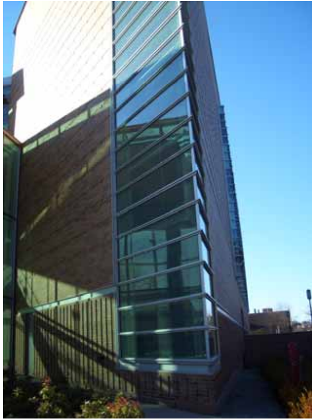
相片十一、銳不可當