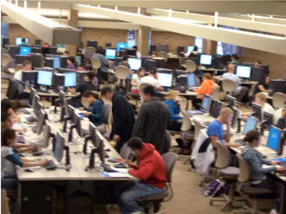
相片七、學生善於利用週日踴躍使用圖書館