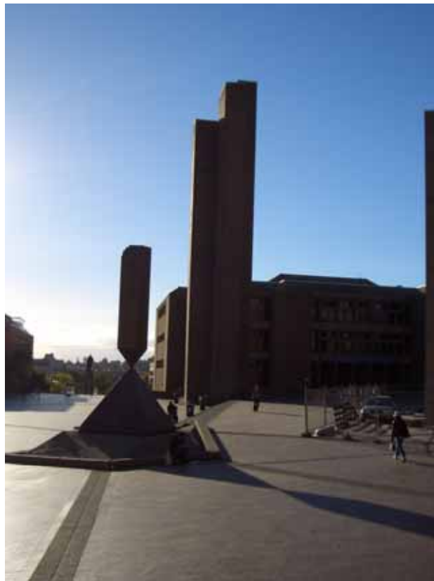
相片十二之一、針鋒相對、危機重重