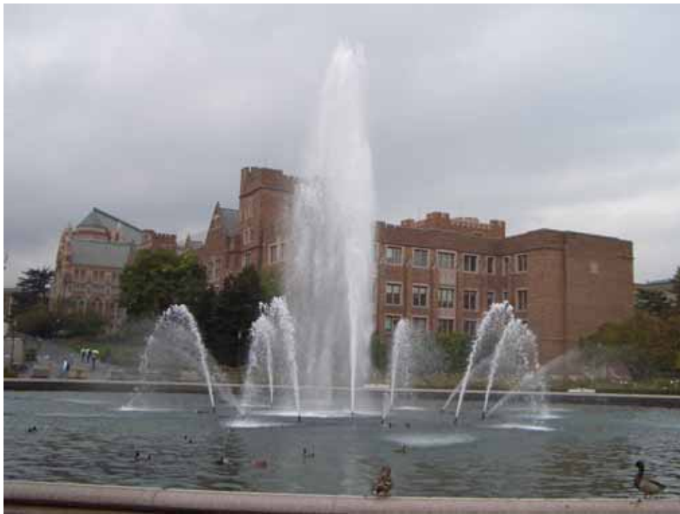
相片十二之三、春風化雨、優遊自得