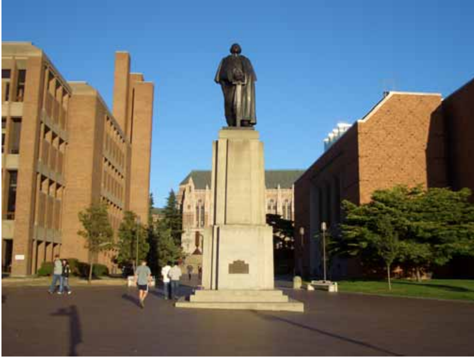
相片二之一、華盛頓大學之古典與現代建築