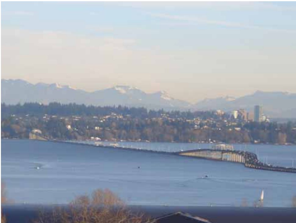
相片四、在比爾資訊大樓上可遠眺群山，近觀華湖