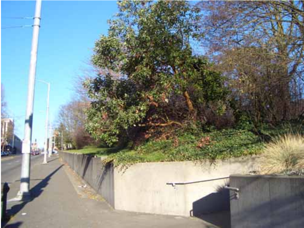
相片九、華大無圍牆