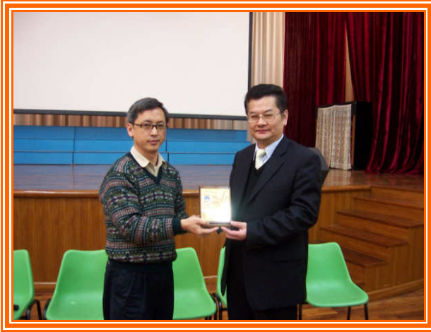
✧ 海星中學校長(左)致贈予本團蘇團長玉龍。