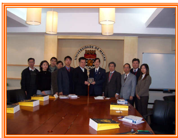
✦ 本宣導團與澳門大學彭教務長執中(右五)合影留念。