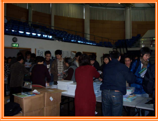
✧ 學生踴躍索取招生說明會資料及簡章