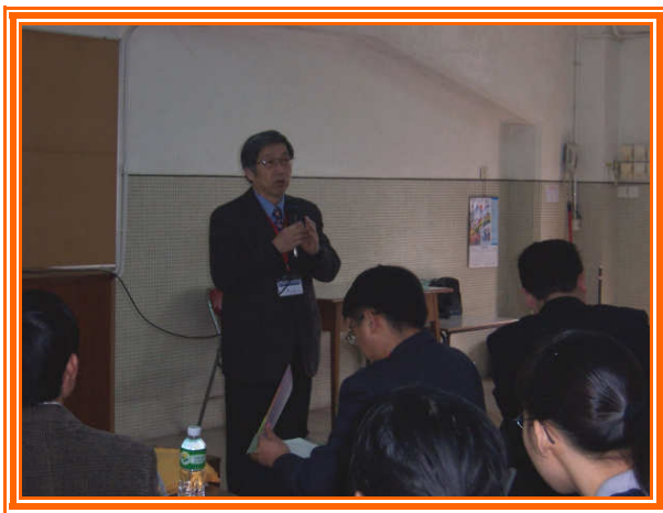
✧ 團員師大黃教務長生說明國立大學現況。