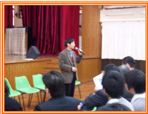
✧ 團員僑大陳組長說明僑大先修修習及生活現況。