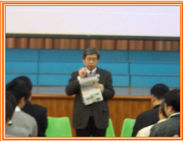
✧ 團員師大黃教務長說明國立學校現況。