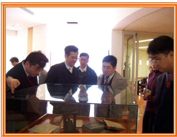
✦ 參觀澳門大學圖書館。