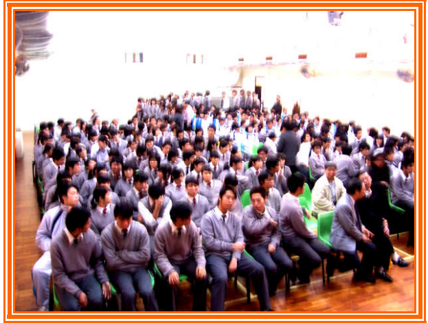
✧ 約 400 名學生參加此次說明會。