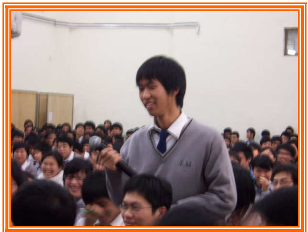
✧ 與會學生踴躍發問。