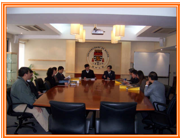
✦ 本宣導團赴澳門大學參訪，進行學術交流。