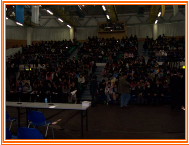
✧ 近千餘人參加招生宣導說明會，盛況空前。