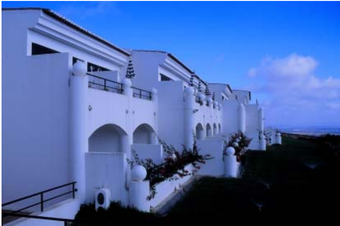
以秋天狩獵聞名的 SoSeul Pousadas ( 4 )