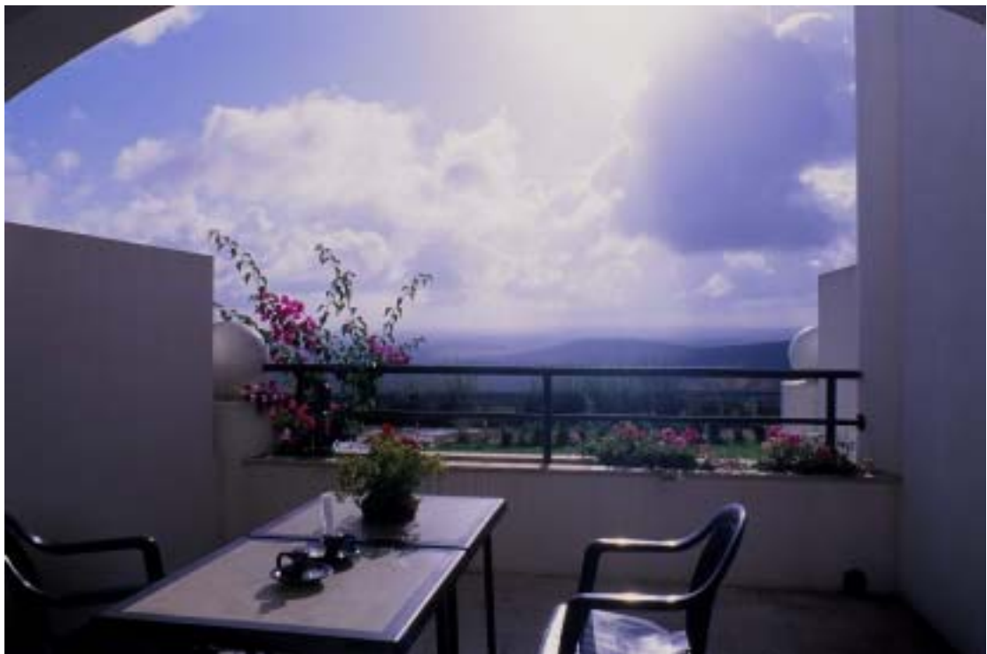
以秋天狩獵聞名的 SoSeul Pousadas ( 2 )