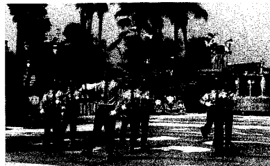
紅場儀隊閱兵表演