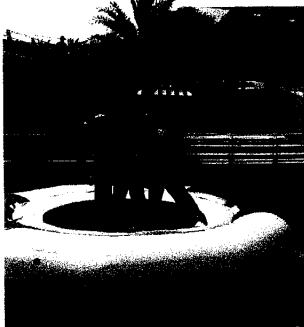
俄羅斯零度果醬三重唱

克里姆林宮廣場旁的「女巫隧道」則有來自俄羅斯的美艷巫師，以傳統的俄羅斯占卜，為好奇的遊客指點迷津。