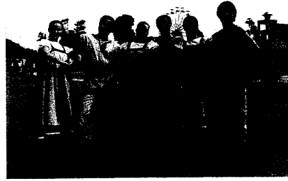
身著傳統服裝漫步街頭的演員

主題區內播放各式各樣的俄羅斯音樂，來自俄羅斯的帥氣主廚，在仿製莫斯科街頭的餐車現場烹製各種俄羅斯輕食點心。