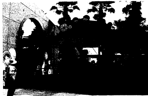
俄羅斯娃娃保齡球

的重要素材，例如，俄羅斯氣候嚴寒，大家喜歡在結冰的河面上鑿洞釣魚，我們便創造了類似的活動，讓遊客在參與趣味活動的過程當中可以體驗俄羅斯的生活趣味，此外如俄羅斯輪盤、俄羅斯賓果、俄羅斯娃娃保齡球等趣味遊戲，都融入了大量的俄羅斯元素，使得遊客不分年齡都可以盡興的參與我們規劃的各項有趣的活動。