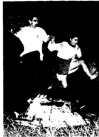
俄羅斯傳統的跳火盆儀式

每天晚間，演出精彩道地的月光舞會儀式，編排在儀式時演出的各項表演，呈現在探索樂園的舞台上，一幕幕精彩的演出，在數千名遊客的掌聲與驚呼聲中，狂歡的氣氛沸騰到最高點。最後在遊客與