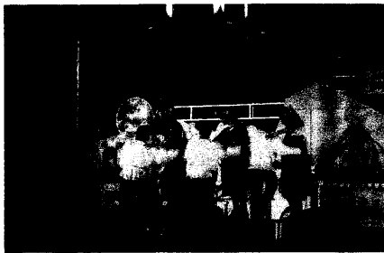
身著傳統服裝演出中的演員

「狂歡」這兩個基點來出發，「俄羅斯」的部分，俄羅斯演員當然是不可或缺的重要因素，在活動期間，參與演出的俄羅斯語系演員，超過 80 位。俄羅斯的傳統表演也不可缺少，我們除了編排、改編俄羅斯的