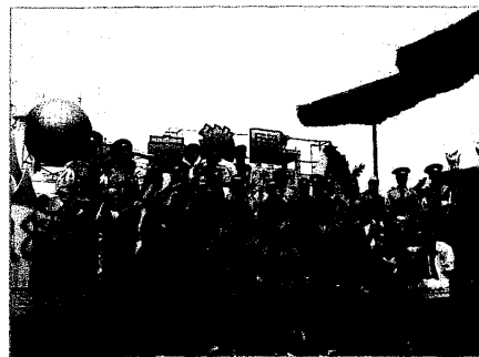
盛大的俄羅斯演員陣容