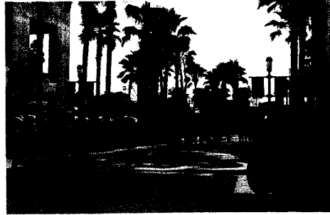
俄羅斯娃娃迎賓大道

以紅場觀閱兵、克里姆林宮看馬戲、莫斯科花園飲茶聽船歌的指導原則下，我們希望在探索樂園能夠創造一