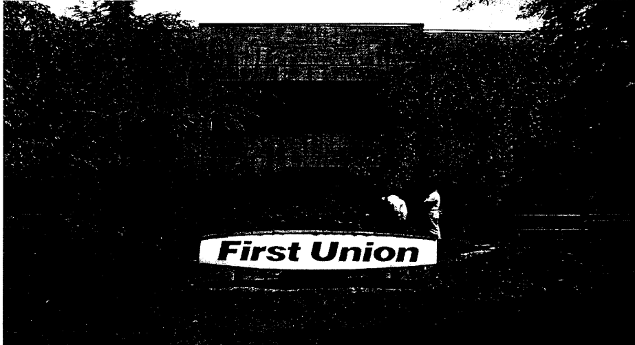
(美聯銀行票據作業處理中心，位於紐澤西州)

美聯銀行為處理其龐大之票據交換數量，在美國共設有 4 處票據作業處理中心，以本次參觀位於紐澤西州的票據作業處理中心為例，該中心約要處理 200 萬張的票據，其票據分類閱讀機計有 8 台，處理模式與國內有點相似，但該行特別在票據分類閱讀時，加裝影像儲存功能系統，當票據通過閱讀機時，同時將該票據正反面影像製成圖片檔記憶在電腦中，而當提回的票據自客戶帳戶扣款後，該紙票據將不再寄還給客戶，該客戶可直接透過網路銀行看到所開出的票據影像是否正確，有無偽造情形等。此措施免除實體寄送之不便及費用外，線上查閱亦大量節省人工成本及客戶往來查詢時間。