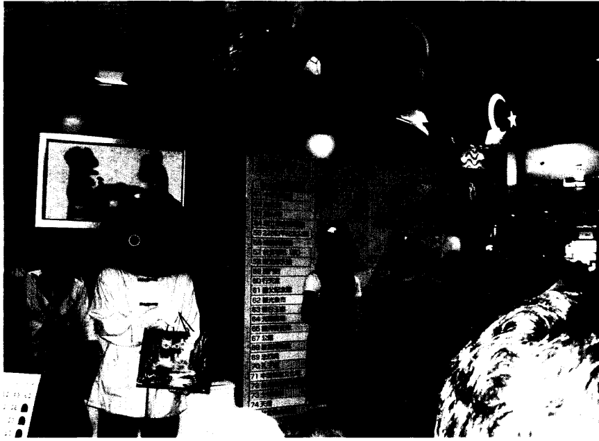
照片七：台灣地名賓果遊戲吸引觀眾從遊戲中認識台灣