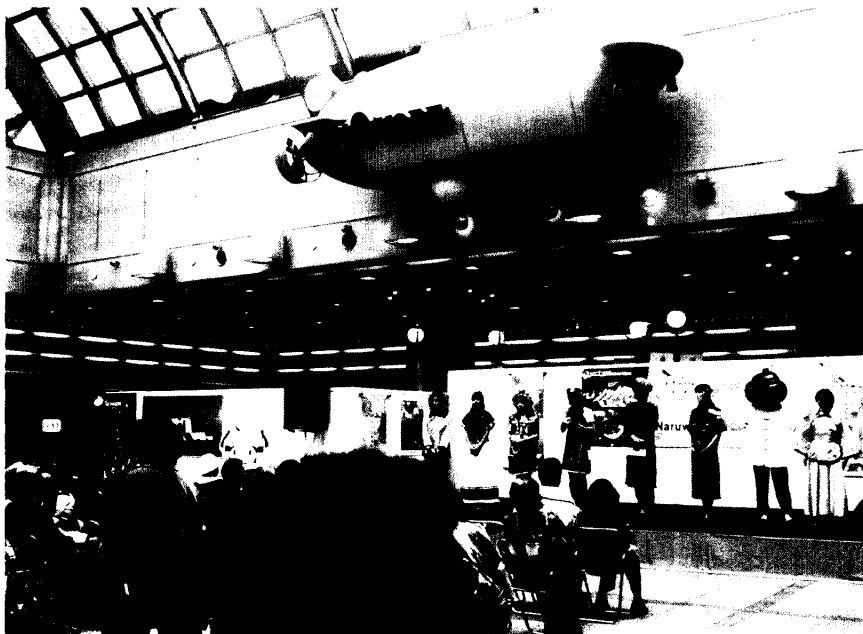
照片八：在神戶 Duo Kobe 廣場之街頭展演