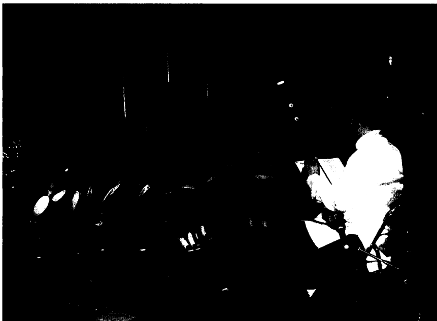
照片六：二胡表演小朋友席地聆聽