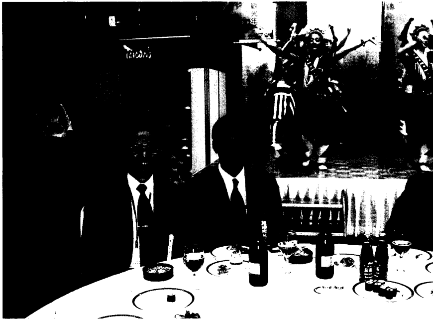
照片三：廣島縣田口尚文副知事參加懇親會