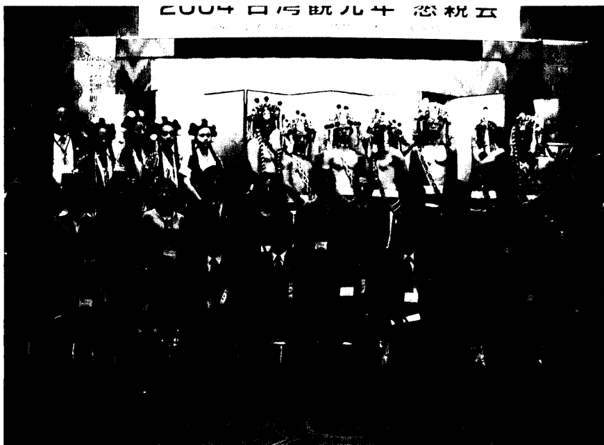
照片四：代表團於廣島懇親會後合影