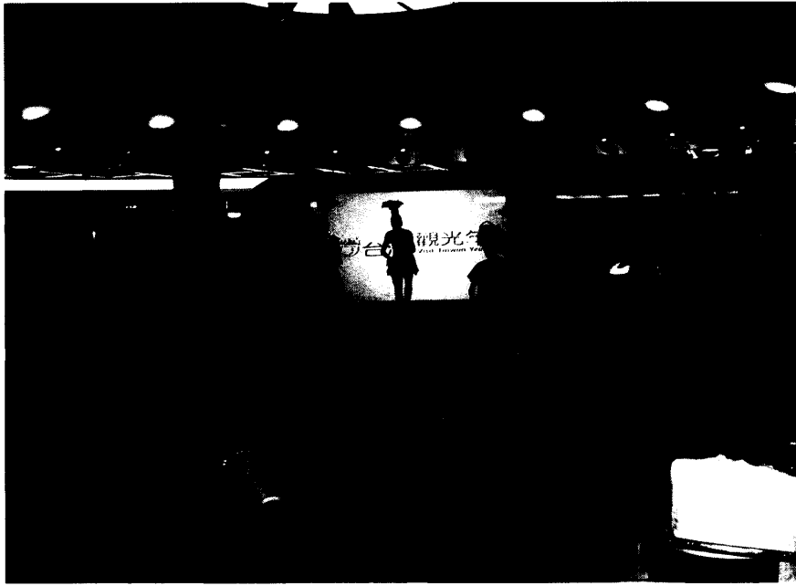
照片一：我國代表團於廣島紙屋町車站廣場表演原住民 舞蹈