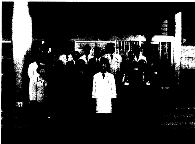
拜訪漢城報勳醫院