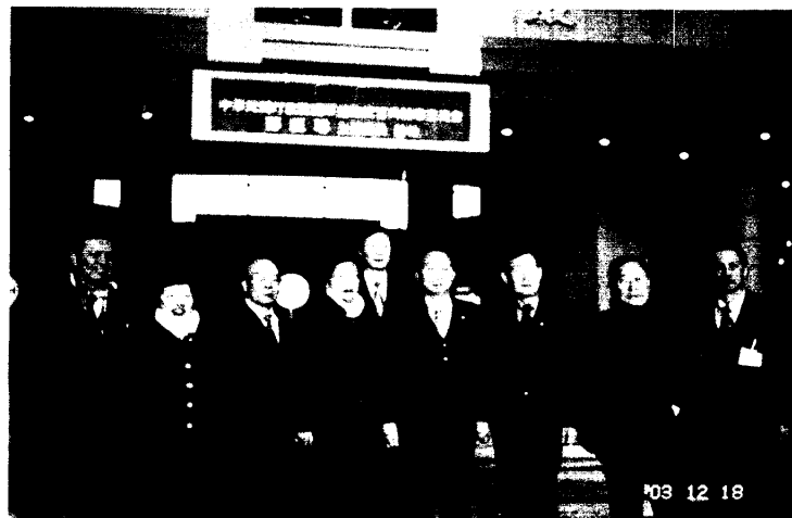
參觀國家戰爭紀念館