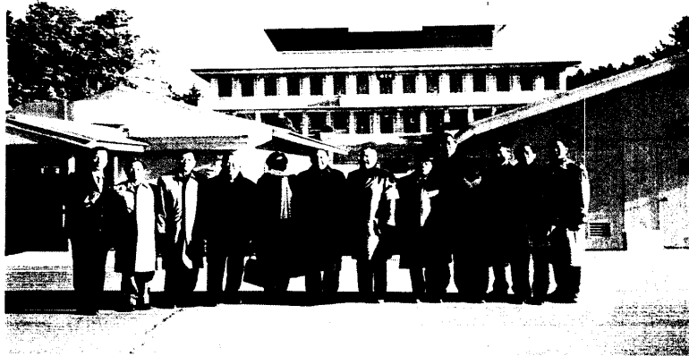
訪問板門店停戰區談判會議室