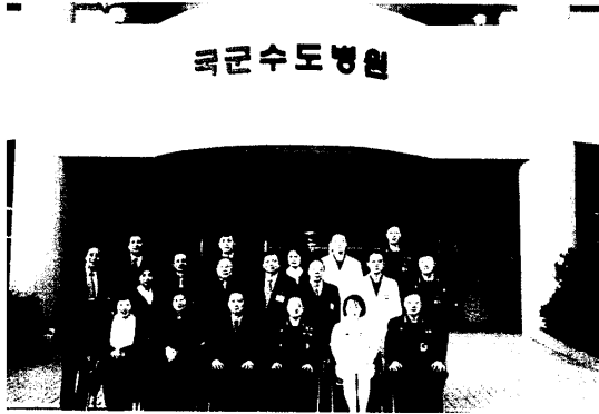
拜訪漢城國軍統合醫院