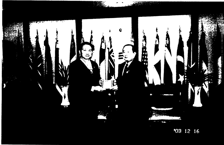
與在鄉軍人會會長李相薰上將互贈紀念章

在鄉軍人會將以國家安全的第二道防線自居，規劃舉辦各種提醒社會反省戰爭、注意國家安全的活動，以喚起民間的警覺。同時，設有「安全研究中心」(The KVA Security Research Center)，將舉辦各種國內與國際的國家安全研討會及講座，資助各種關於國家安全的研究，促進國內外各種與國家安全相關組織的彼此合作，並尋求合法途徑對抗那些有威脅國家安全可能的實體，以謀求國家的長治久安，人民的快樂幸福。