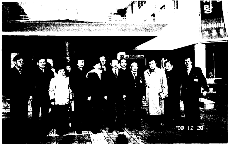
參觀江原道水原報勳院