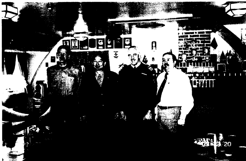
鄧主任委員與聯合國停戰監督委員會 行政組何諾特組長及瑞典、瑞士代表合影