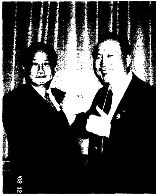
鄧主任委員與報勳處安周燮處長 共同祝福兩國邦誼永固國運昌隆

紀念局、社會救濟服務局，以及五個地方服務處、二十個區服務處、五十二個國家公墓管理處，並在報勳處下設有功勳者與退伍軍人權益委員會等單位。其組織表及對退伍軍人權益保障分析，如附表一、二。