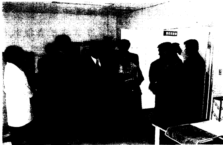
參觀江原道水原報勳院