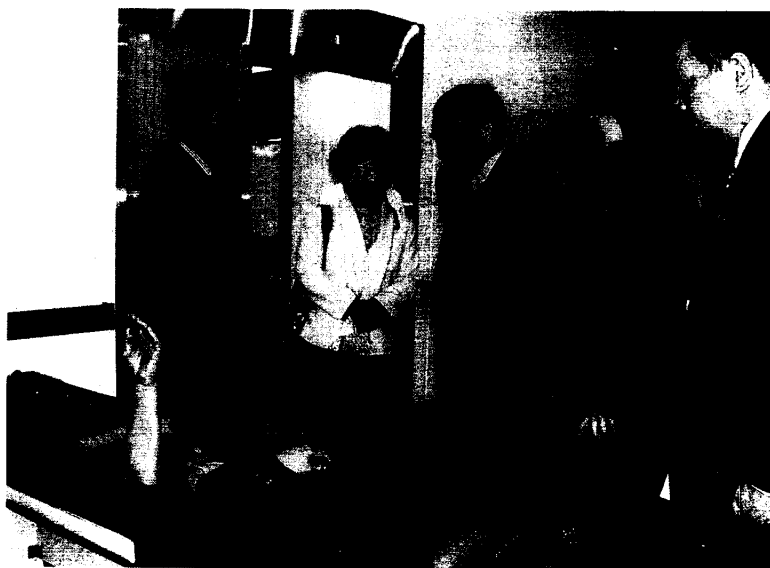
參觀漢城報勳醫院