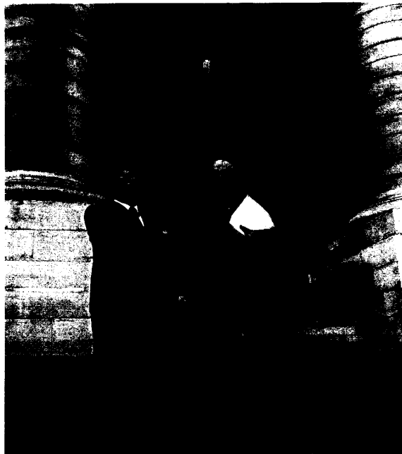
林所長與巴黎地方法院檢察署副檢察長 Monsieur Thorel 合影