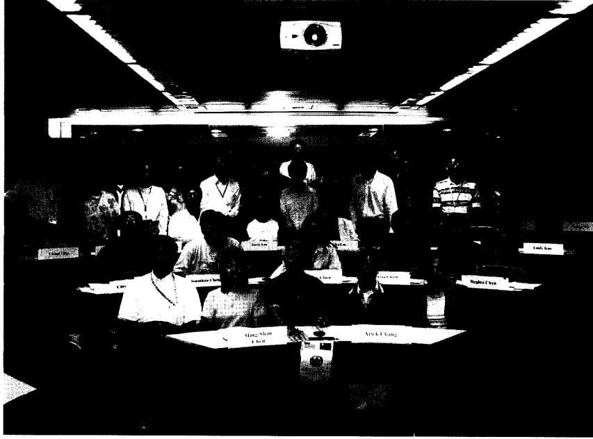
附件一：學員參加研訓課程照片