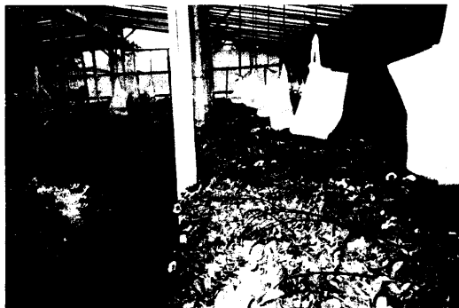
圖 10.設施完全是自己以竹、木搭架而成，黃色塑膠袋裝水，外塗抹油，用以誘殺小虫，類似我們的黃色粘板