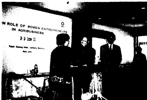
圖 27. 頒發結業證書