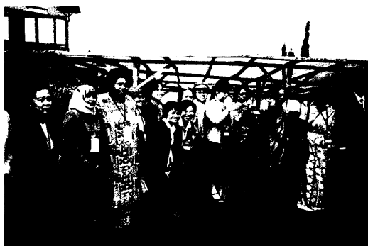
圖 11.參觀農場歡樂的情境