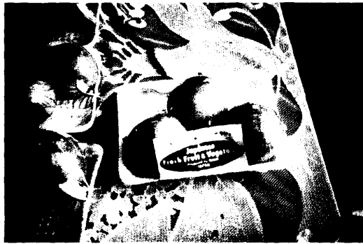
圖 21.農場賣有機蔬菜