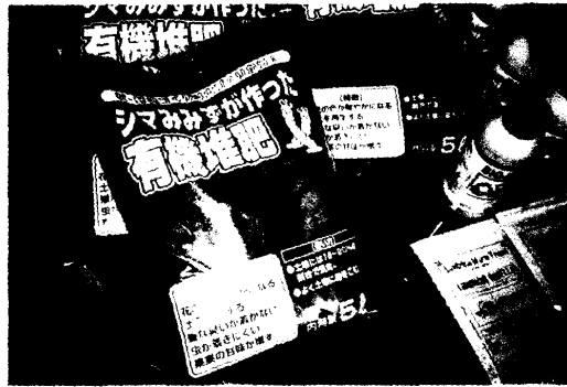
圖 25. 蚯蚓糞堆肥裝袋，供銷售