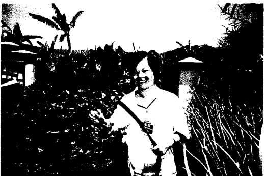
圖 16.參觀有機農場，種草莓、蔥