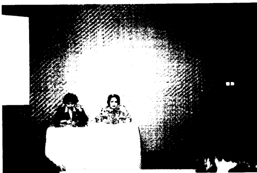
圖 4.參觀 Inkarla 休閒農場，場主作簡報