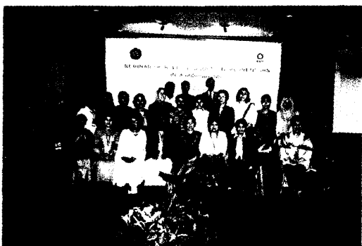
圖 28. 結業全體留影