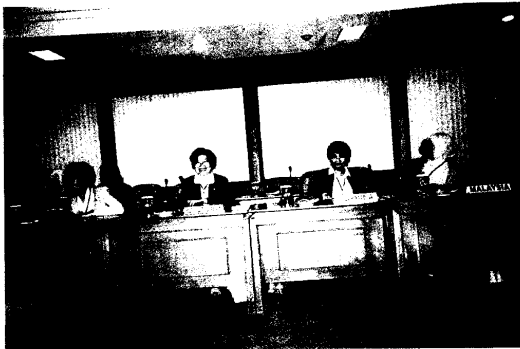
圖 3.開幕式會場內，我以中華民國代表參加