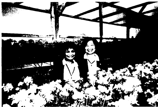
圖 9.切花及盆花的生產情形