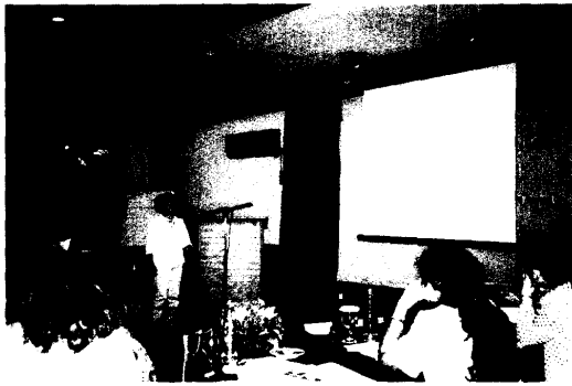
圖 13.中華民國代表報告