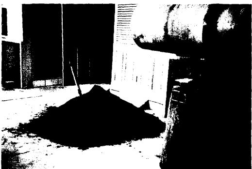
圖 24.蚯蚓糞堆肥成品過篩