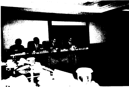
圖 2.開幕式由 APO、NPO 及印尼政府官員共同主持