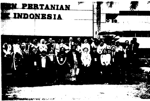
圖 1.開幕式全體合影在印尼農業行政大樓