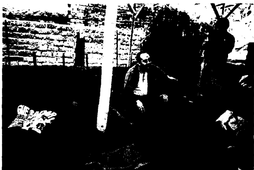
圖 23.製作蚯蚓糞堆肥