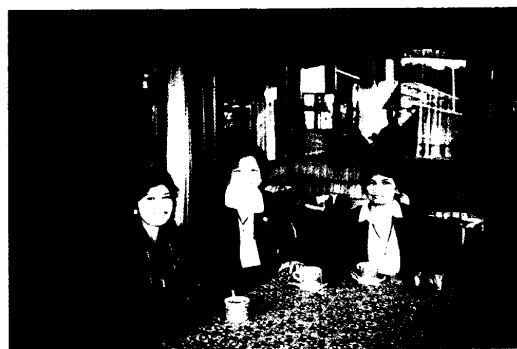
圖 8.在 Inkarla 農場品嚐其產品