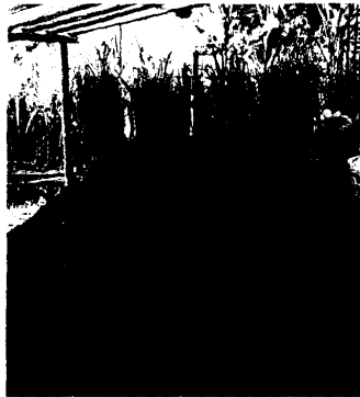
圖 20.農場兼生產牛糞堆肥