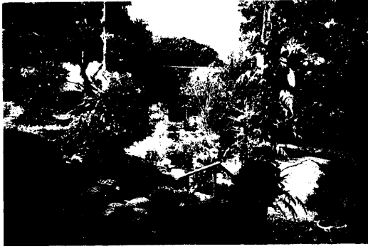
圖 5.Inkarla 農場造景之一