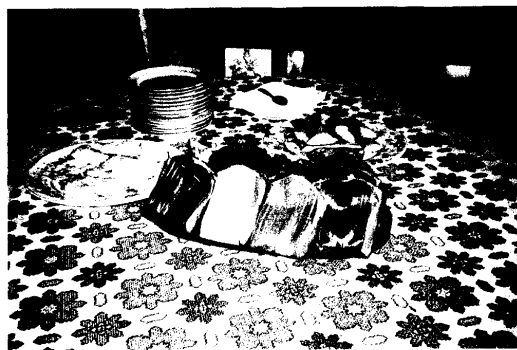
圖 7.農場製作的美食