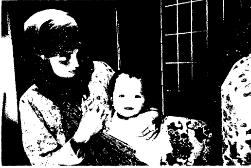
圖 17.農家婦女與小孩