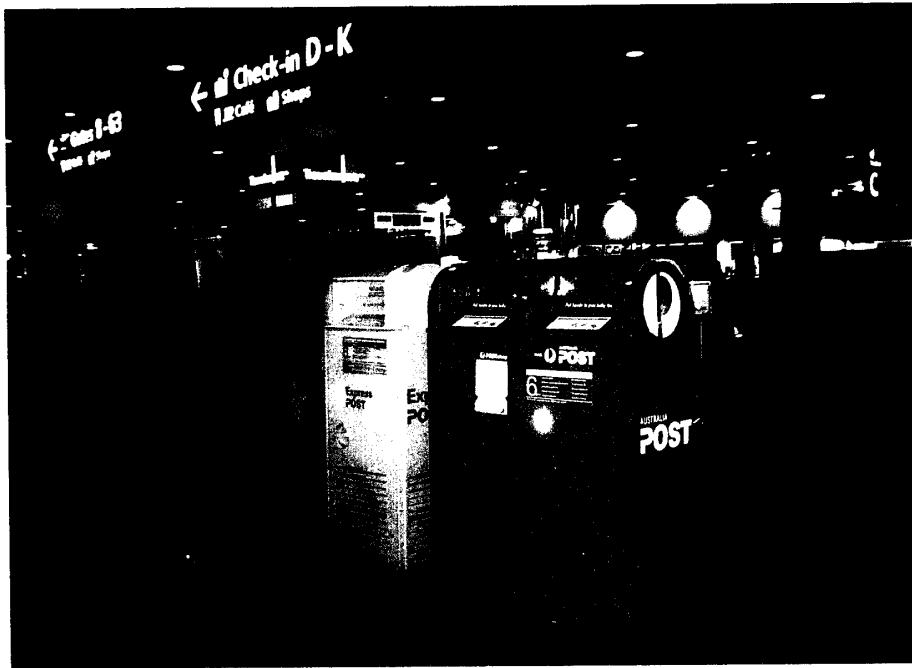
圖七 澳洲郵政置於航空站之郵筒式樣