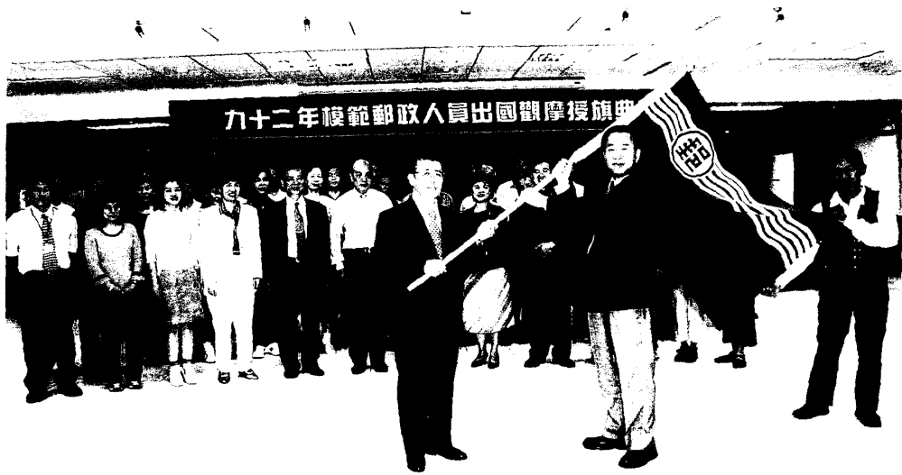
圖一 葉副總經理於出發前授旗