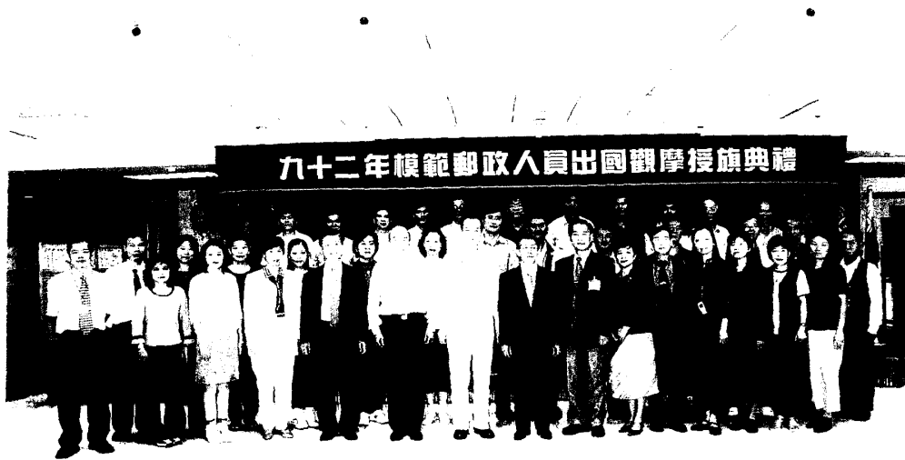
圖二 葉副總經理與全體郵政模範人員合影留念