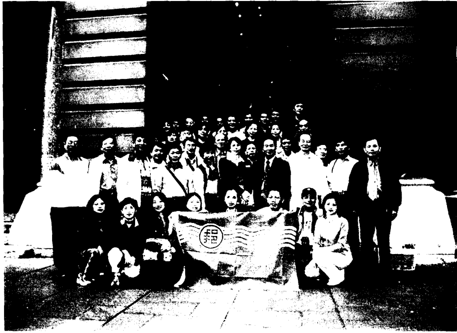
圖三 參訪澳郵雪梨市郵政總局直轄支局與經理合影留念