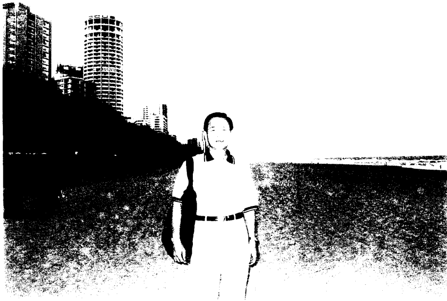
圖十 黃金海岸綿延千里之金色沙灘