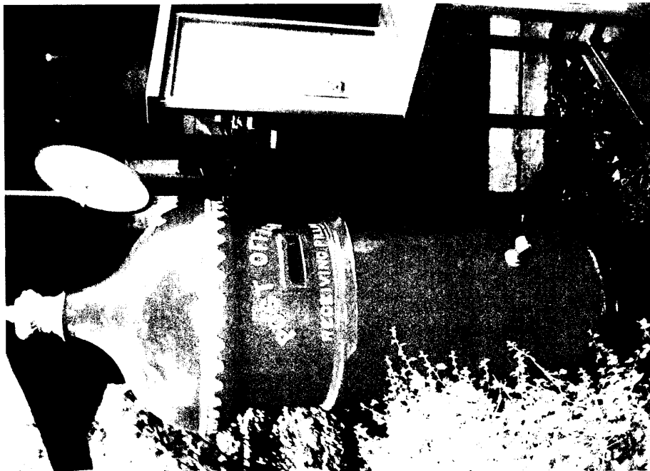
圖八 澳洲郵政置於風景區之郵筒式樣