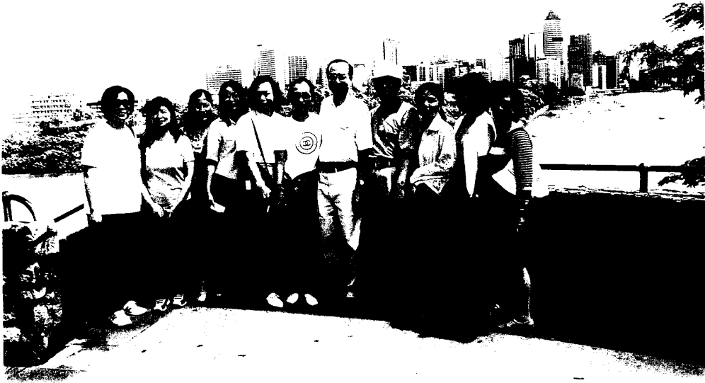
圖九 部分團員於布里斯本河畔合影留念