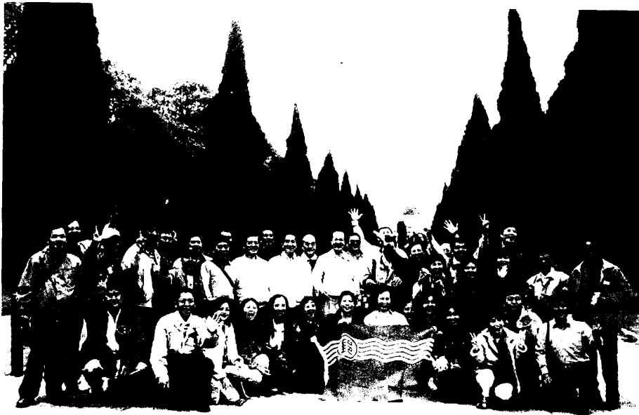
圖四 全體團員於喬治亞廣場前合影留念