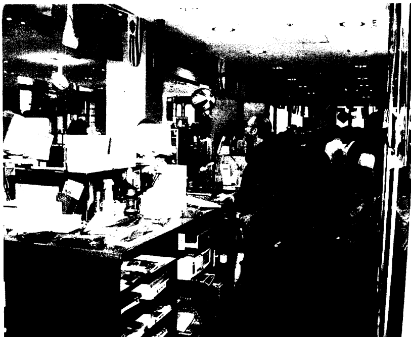
圖五 澳郵郵務窗口人員採站立服務情形