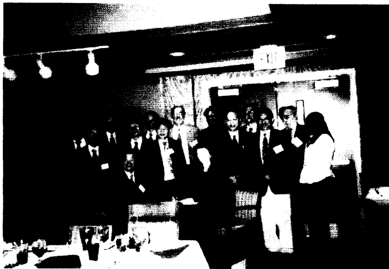
參與合作交流協議書簽署儀式相關人員合影