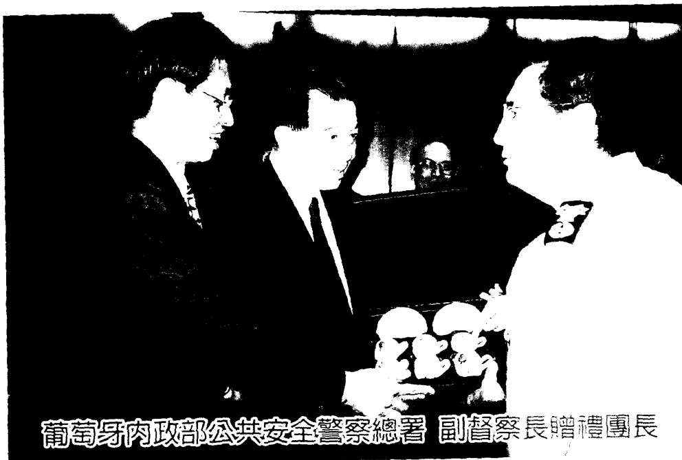
葡萄牙內政部公共安全警察總署 副督察長贈禮團長