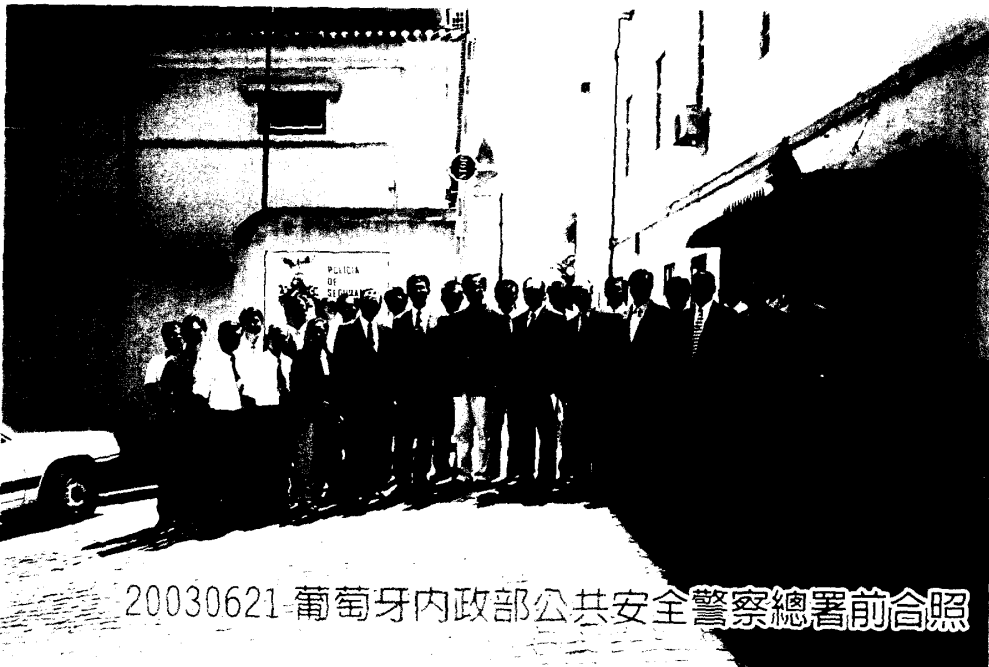
20030621 葡萄牙內政部公共安全警察總署前合照