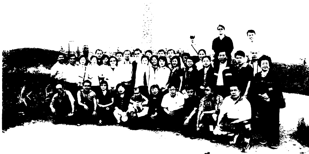
20030622 葡萄牙 里斯本慶生會