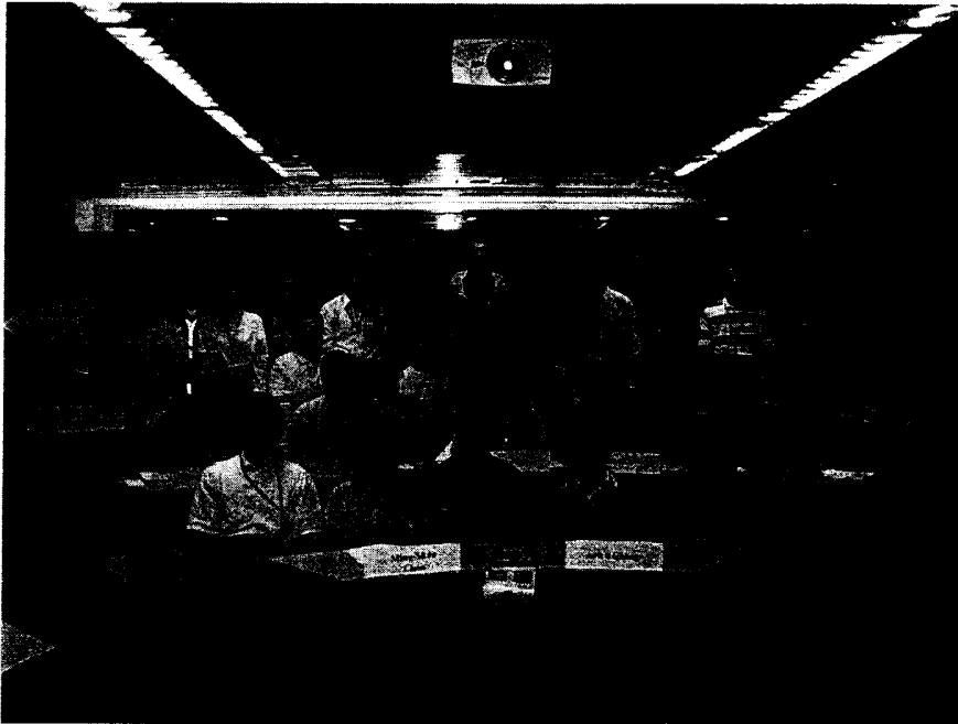
附件一：學員參加研訓課程照片