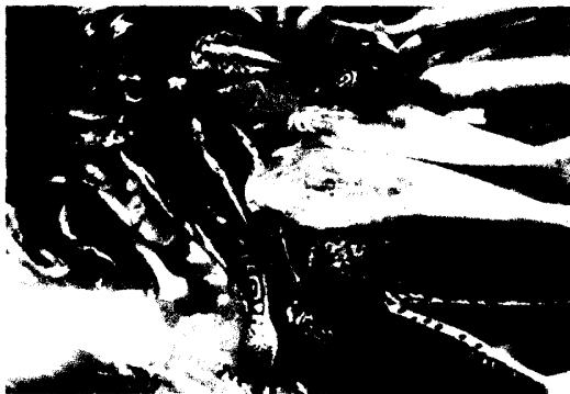
亞馬遜地區之代表魚類之一，Surubim ( Pseudoplatystama sp.)