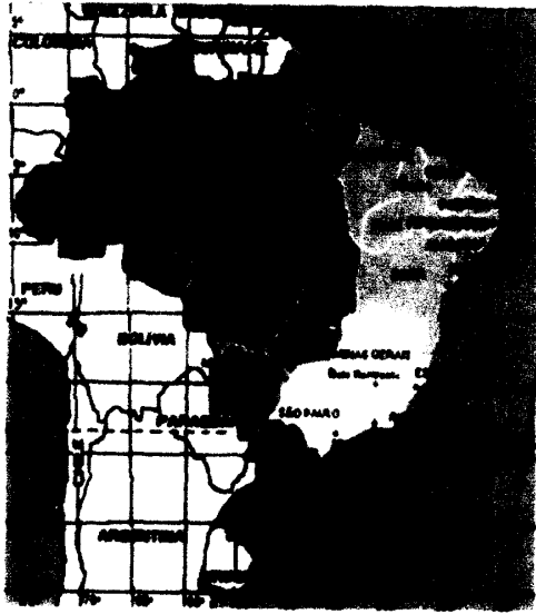
巴西養殖五大區圖示：北部地區（綠色）、東北地區（橘色）、中西地區（藍色）、東南地區（黃色）、南部地區（紅色）