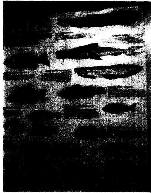
亞馬遜州具經濟價值主要魚類之掛圖