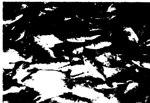
亞馬遜地區之代表魚類之一，Piraputanga ( Brycon hilarii )