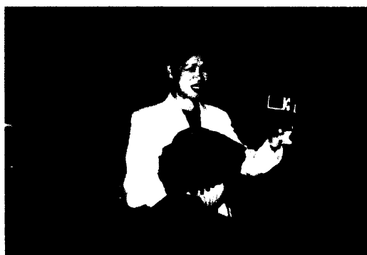
作者演講「九孔染色體操作及其自動化在台灣之進步現況」之後，以動態畫面介紹自動化流程