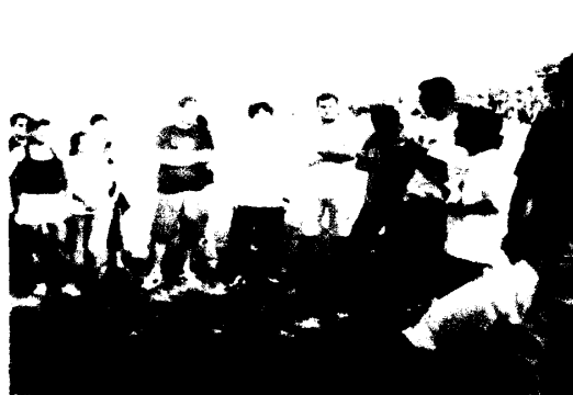
筆者前往亞馬遜聯邦大學實習農場參訪學生們實習的狀況