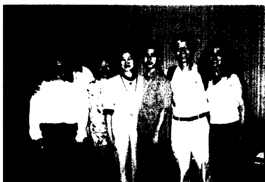
作者演講「基因修飾水產生物之規劃的基要關懷」之後與部分聽眾合影