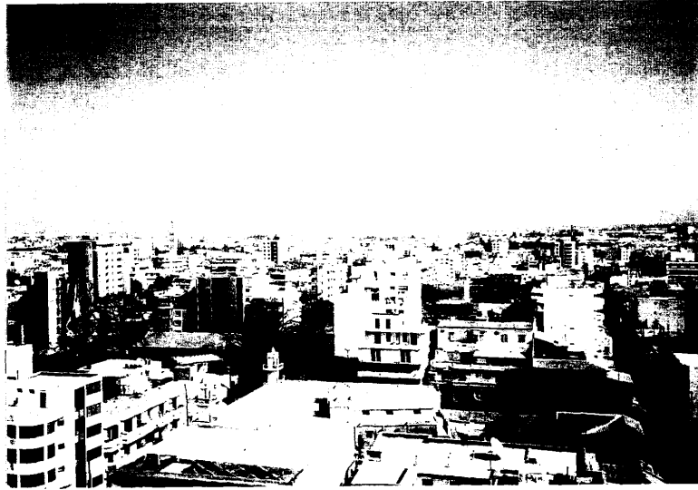
塞內加爾首都達卡市容