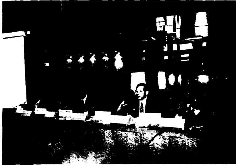
周處長演講「Manufacturing Experiences of Taiwanese SMIS」