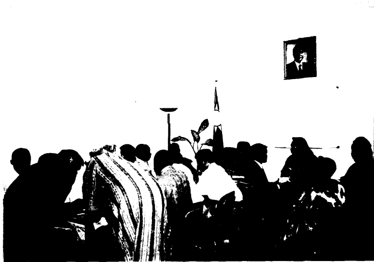
3月29日於我國駐塞內加爾大使館舉行「塞國青年企業組織投資合作洽談會」