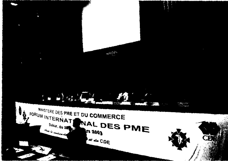
3月26日塞內加爾瓦德總統（His Excellency M.Abdoulaye WAADE）主持「中小企業國際論壇」開幕典禮