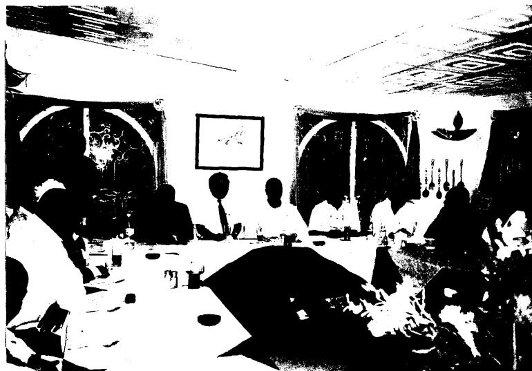
甘比亞「促進貿易暨自由區管理局 GIPFZA」局長暨 行政主管本團團員設宴歡迎，林大使俊義為陪賓