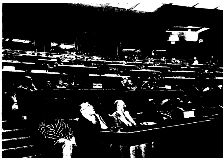
大會(上)及研討會(下)出席踴躍之盛況