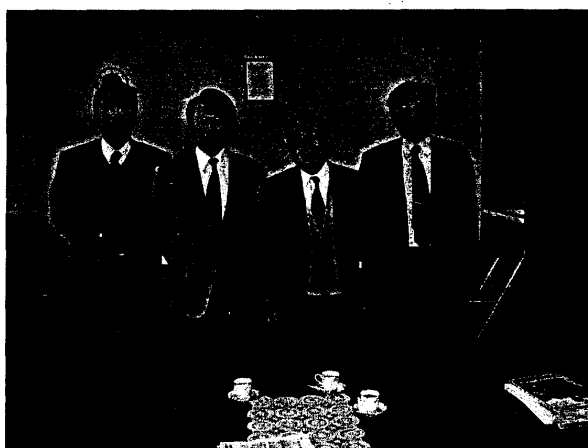
谷校長拜會流通科學大學校長