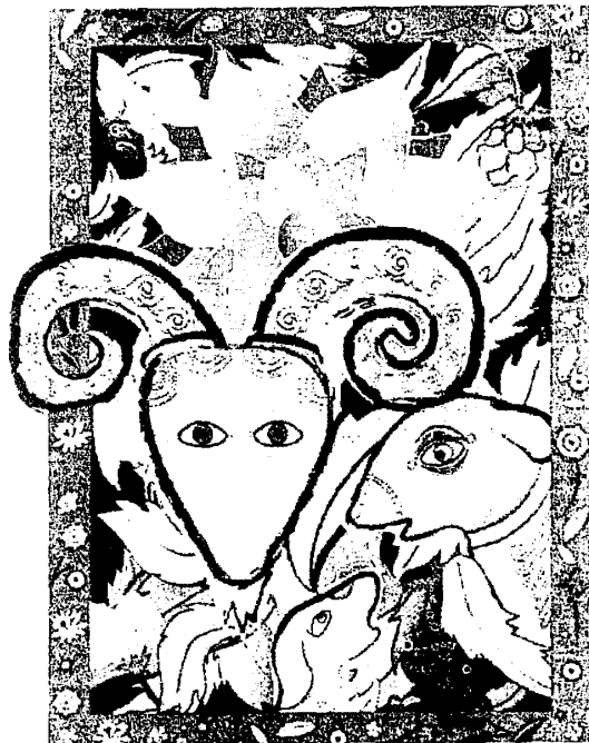
「三陽開泰」，為「羊年特展」展出的版畫作品之一。

古字「羊」與「祥」互通，羊有角但不好鬥，羔羊食乳，必跪而受之，種種特質使得羊在中國或聖經中，都是溫順的形象，無論在美術或工藝作品