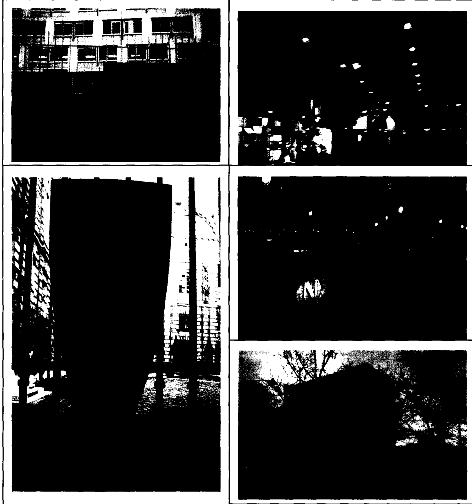
圖說 上左 聯合國教科文組織門口 上右 聯合國教科文組織內部一景 下左 古蹟說明牌 中右 塞納河古橋夜景 下右 凱旋門