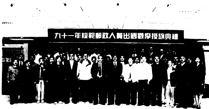
圖二 鄭總局長與全體郵政模範人員合影留念