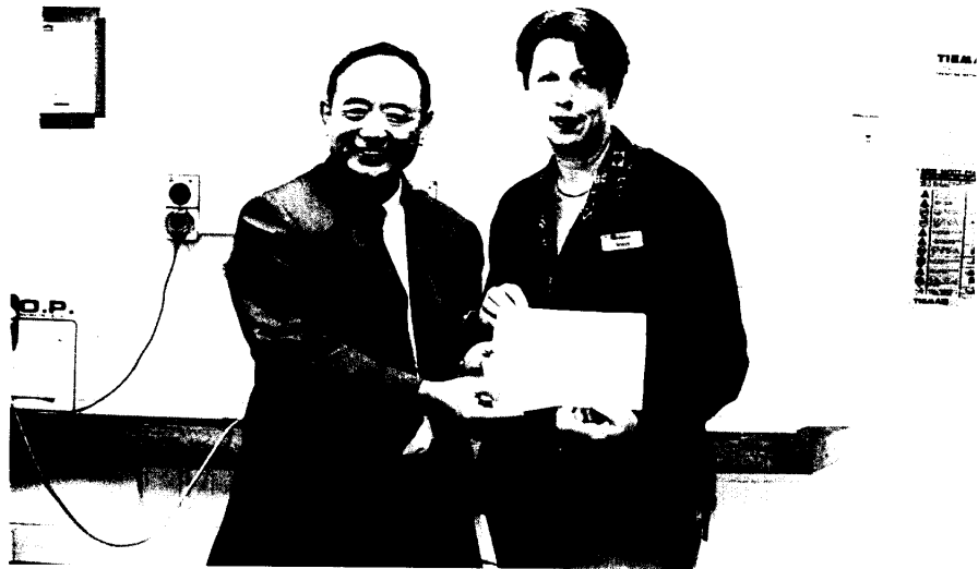
圖三 領隊蕭局長致贈紀念品與澳郵接待經理合影