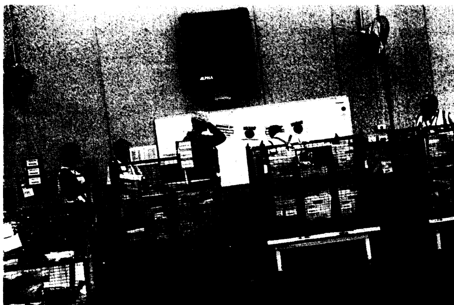
圖五 參觀郵件處理中心