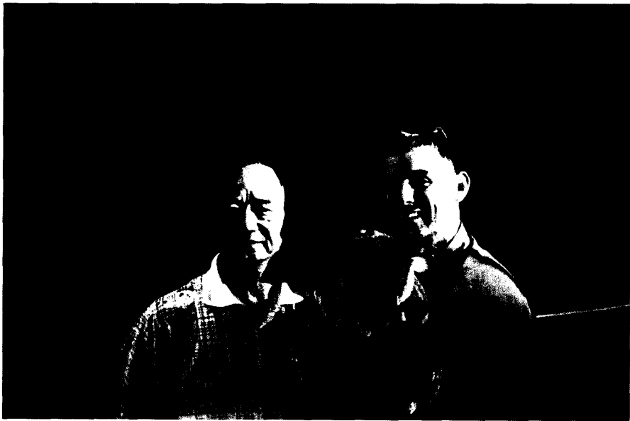
圖十 與無尾熊合影