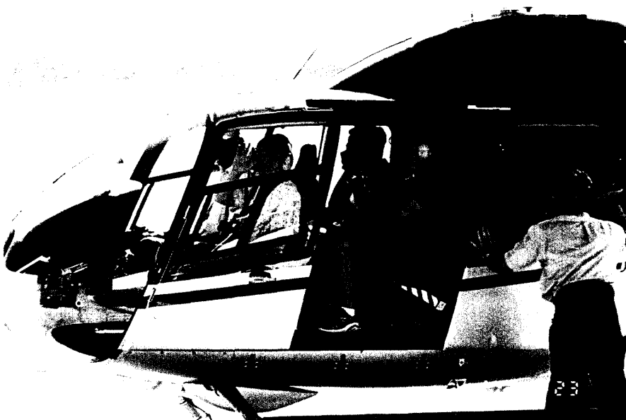
圖六 乘坐直昇機遊覽