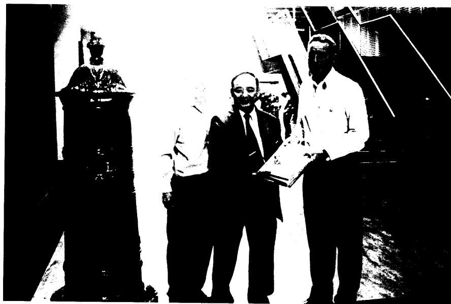
圖四 領隊蕭局長致贈紀念品與郵件處理中心負責人合影留念