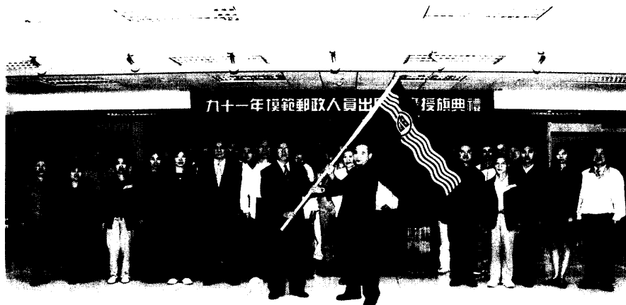
圖一 鄭總局長於出發前授旗