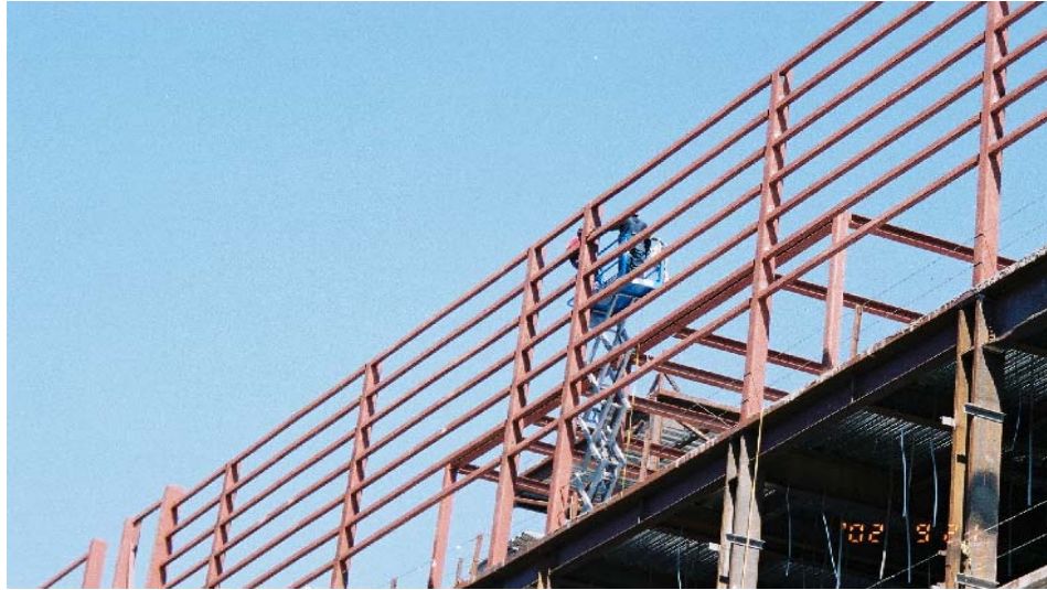
圖 11 使用高空作業車從事高架臨時作業情形