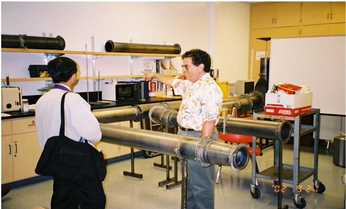
圖 13 參觀加州州立大學環境及職業衛生系之實驗室設備

該系亦設計一系列有關「危害物質及廢棄物管理認證」(Certificate in Hazardous Materials and Waste Management)之相關課程，特別著重於毒性物質、危害物質及廢棄物管理等相關領域，以提供諸如企業人士、政府部門、研究機構等在職人員之訓練機會，受訓期滿授予結業證書。