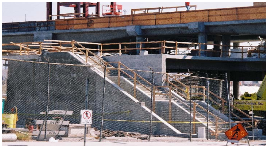
圖 9 工地現場樓梯、開口等護欄之設置情形