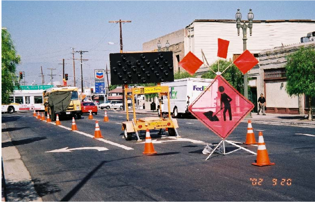
圖 6 使用道路作業時工作場所之交通標示