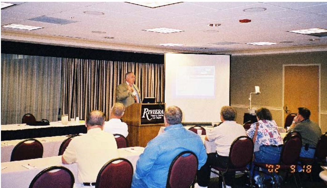
圖 4 Vahid Ebadat 博士講授情形

防止粉塵爆炸災害，控制在其爆炸下限以下是不可能的，又欲將著火源完全去除也有實際困難，將空氣中氧氣濃度降至界限氧量以下更是不可行，因此，防護對策就是防止災害之擴大，設計、裝置及妥善處理適當的壓力釋放設備，以及須掌握粉塵爆炸壓力及壓力上升資料。(圖 4)