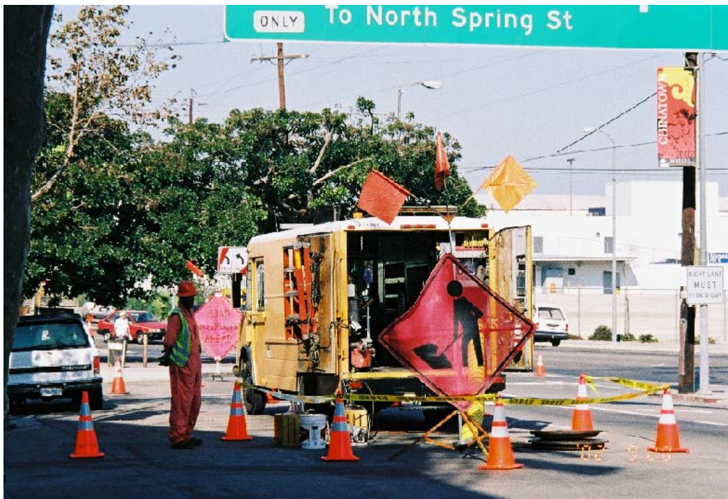
圖 7 從事侷限空間作業時之在場監視人員