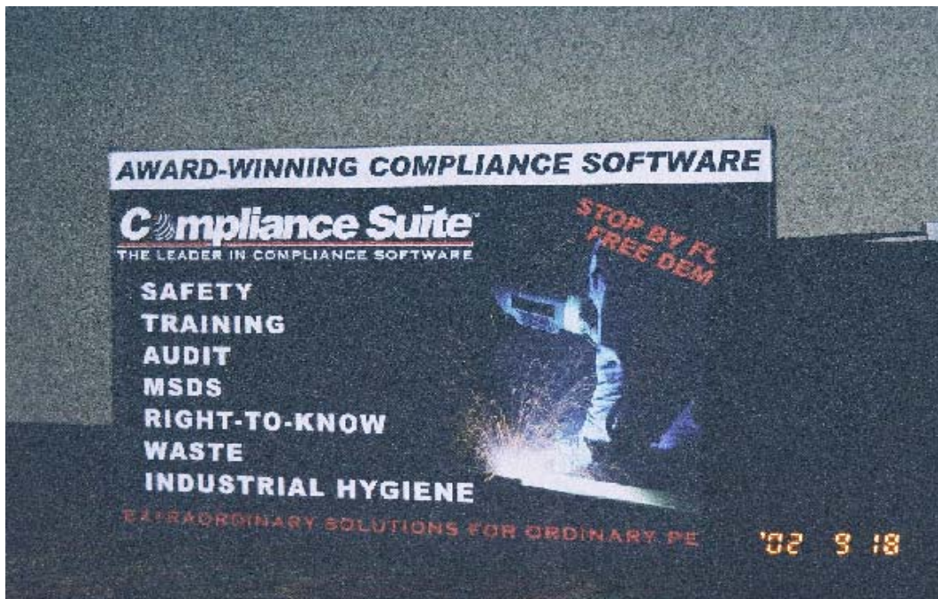
圖 1 展覽會場照片（一）

行中，主辦單位另於會場外研設有展覽會，內容為地方職業安全衛生相關組織及事業單位辦理成果暨商品展示。展示照片如圖 1、圖 2 所示。