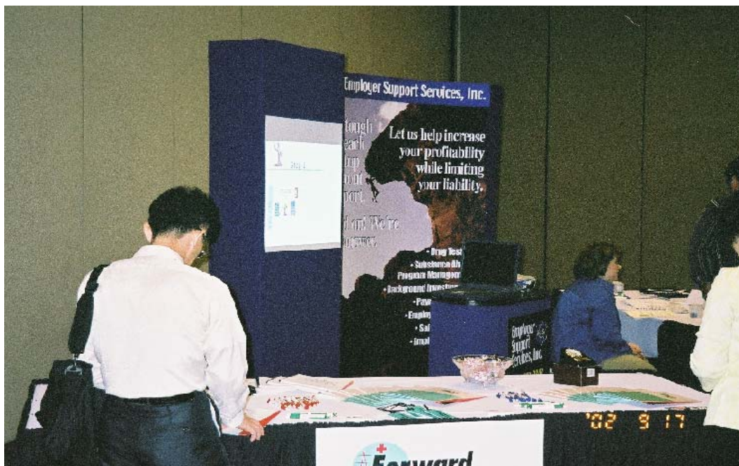
圖 2 展覽會場照片（二）