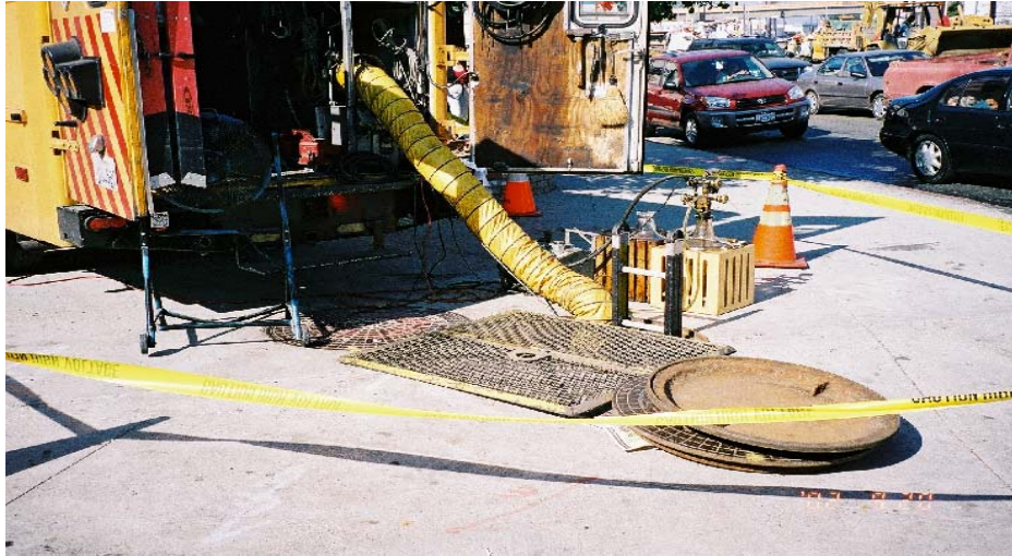
圖 8 從事侷限空間作業時之通風換氣設施