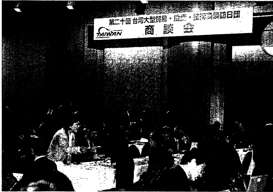
照片五：橫濱商談會現場現況-1