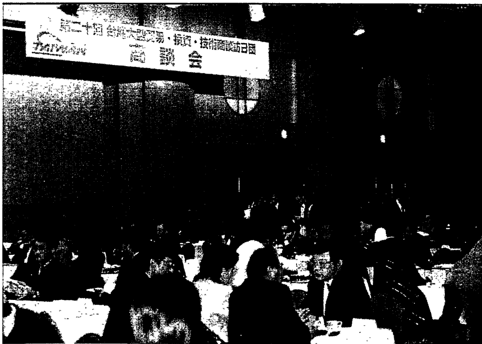
照片六：橫濱商談會現場現況-2