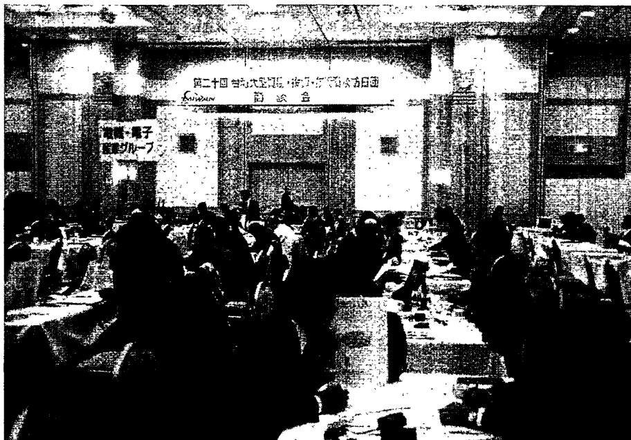
照片一：名古屋商談會現場現況-1