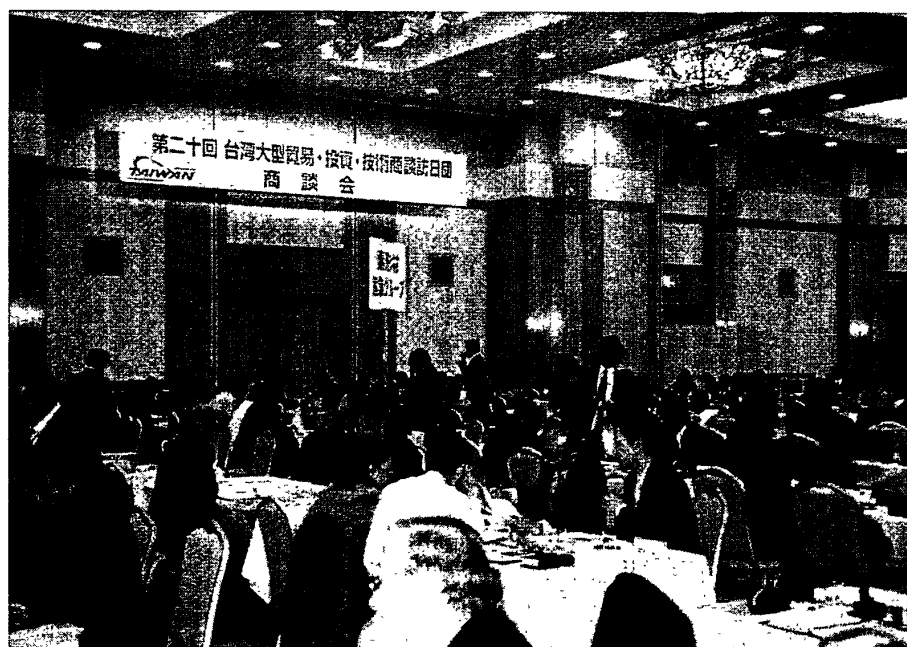
照片二：名古屋商談會現場現況-2