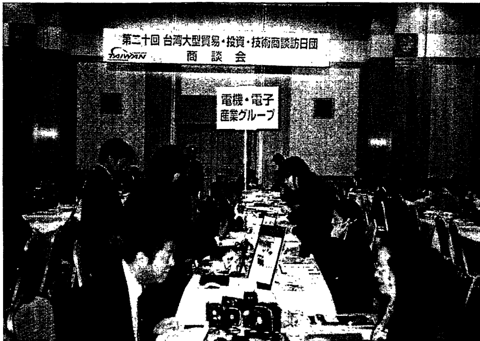
照片三：名古屋商談會現場現況-3