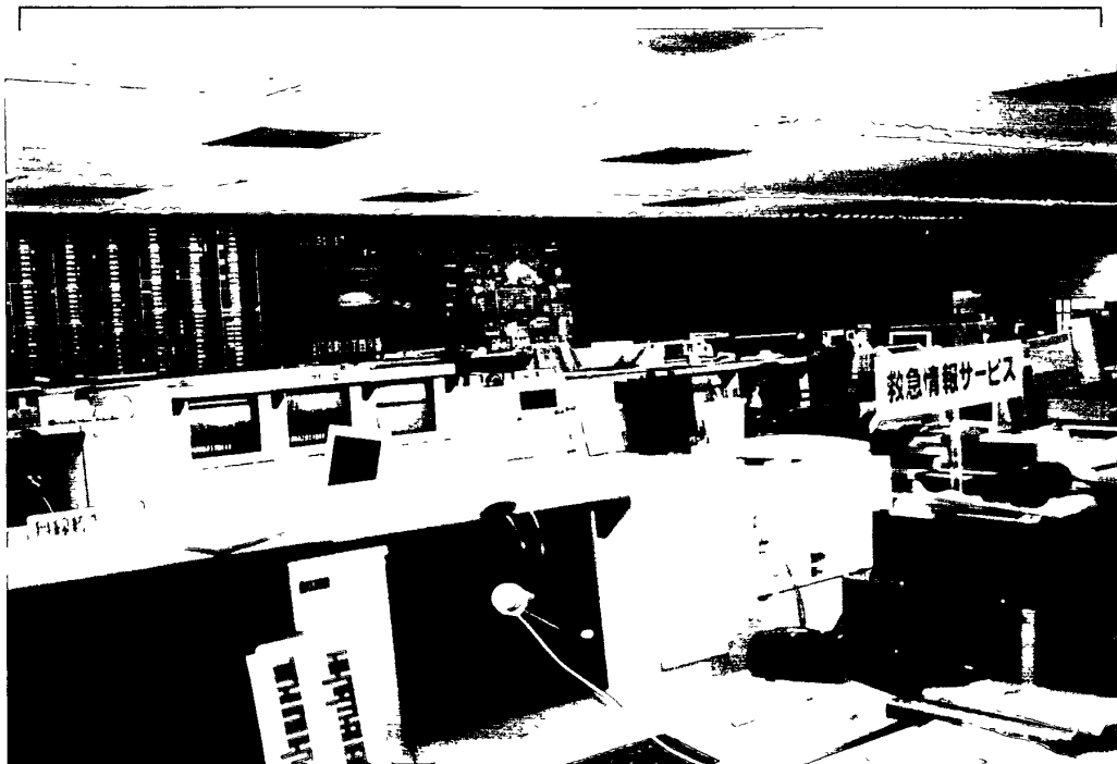
照片二：參觀大阪市消防局救災救護指揮中心