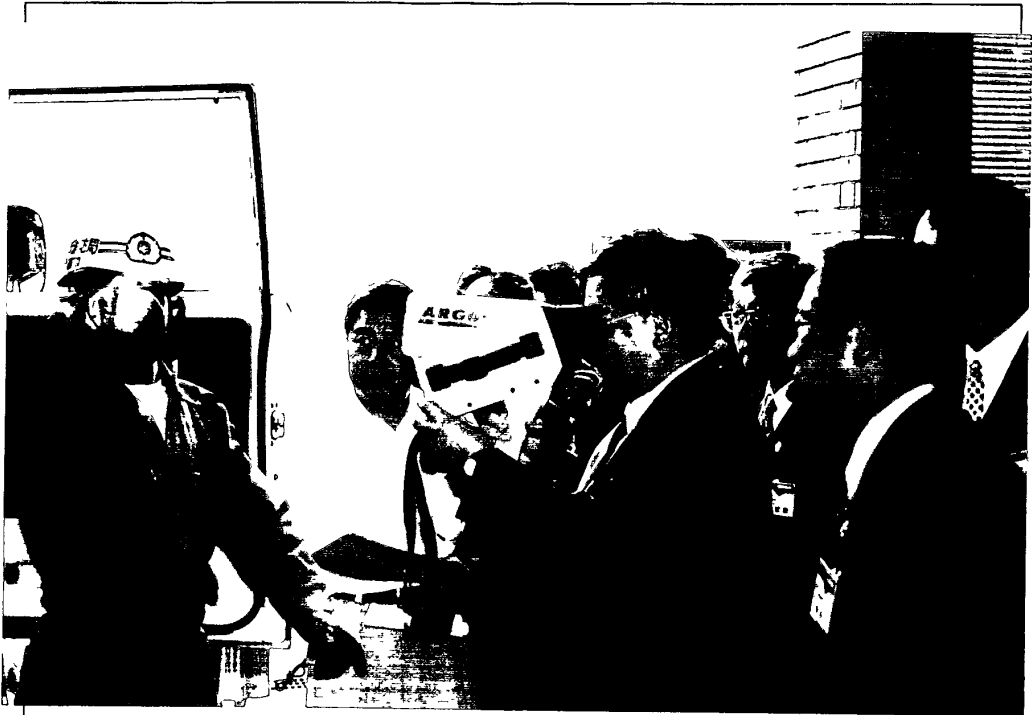
照片一：大阪市消防局救災器材展示及操作