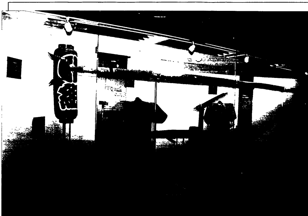
照片三：東京消防博物館（一）