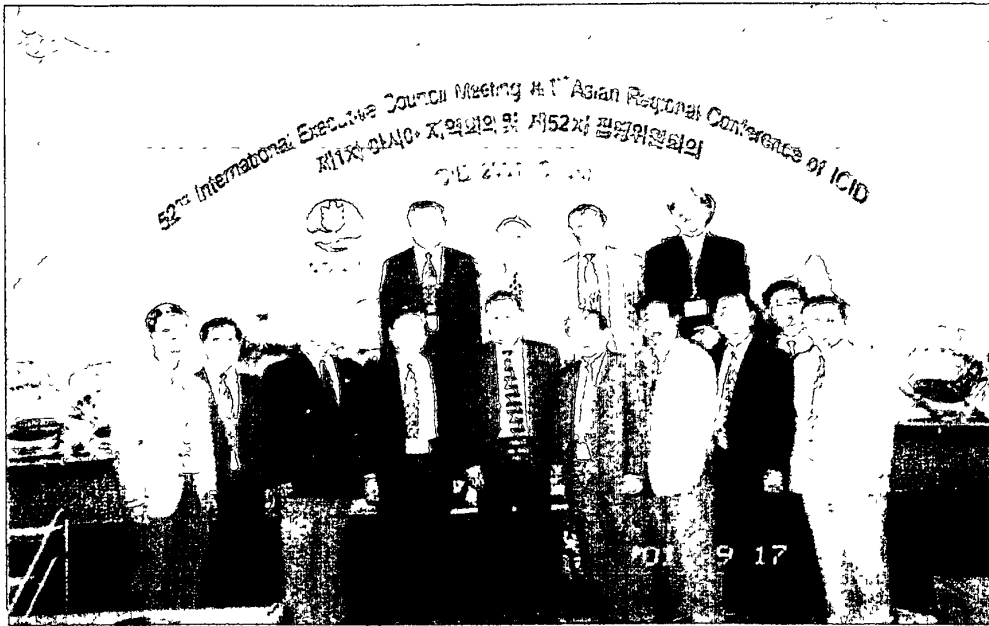
我國代表團成員參加韓國漢城大會開幕之合影