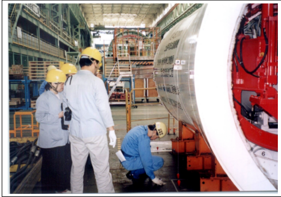
照片三 潛盾機試驗前調整