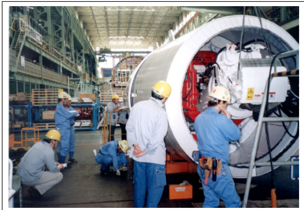
照片二 潛盾機外部及內部檢視