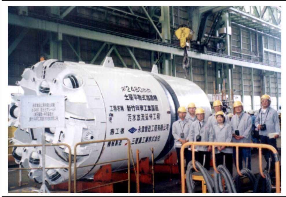
照片一 潛盾機外觀