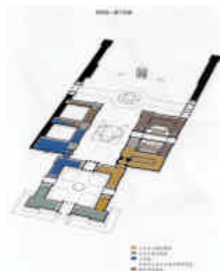
博物館中二 層平面圖