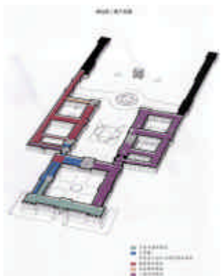
博物館二層 平面圖