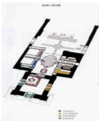
博物館一層 平面圖

羅浮宮藝術博物館分七個展區：古代東方藝術展覽區（包括伊斯蘭藝術）、古埃及藝術展覽區、古希臘藝術展覽區、古西伊特魯立亞和古羅馬藝術展覽區、繪畫藝術展區、素描藝術展區、雕刻藝術展區、工藝藝術展區等組成一座輝煌富饒的藝術宮殿。讓造訪遊客能深入去發覺它的奧祕與鑒定它的真跡所在。（相關平面配置圖如下所示）