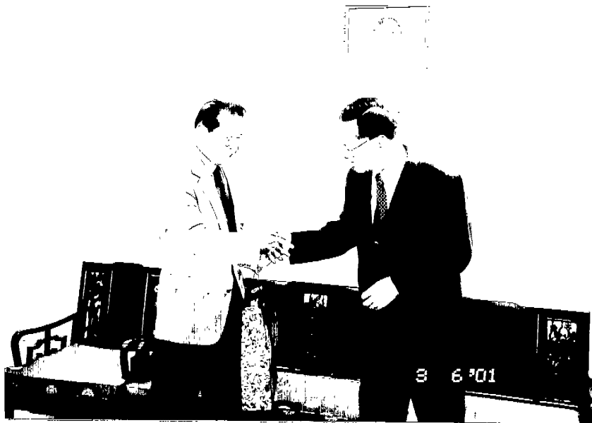
拜會我駐泰國代表處與黃代表顯榮會晤