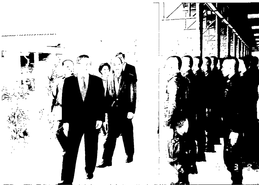
校閱泰國警官學校跳傘訓練中心學員