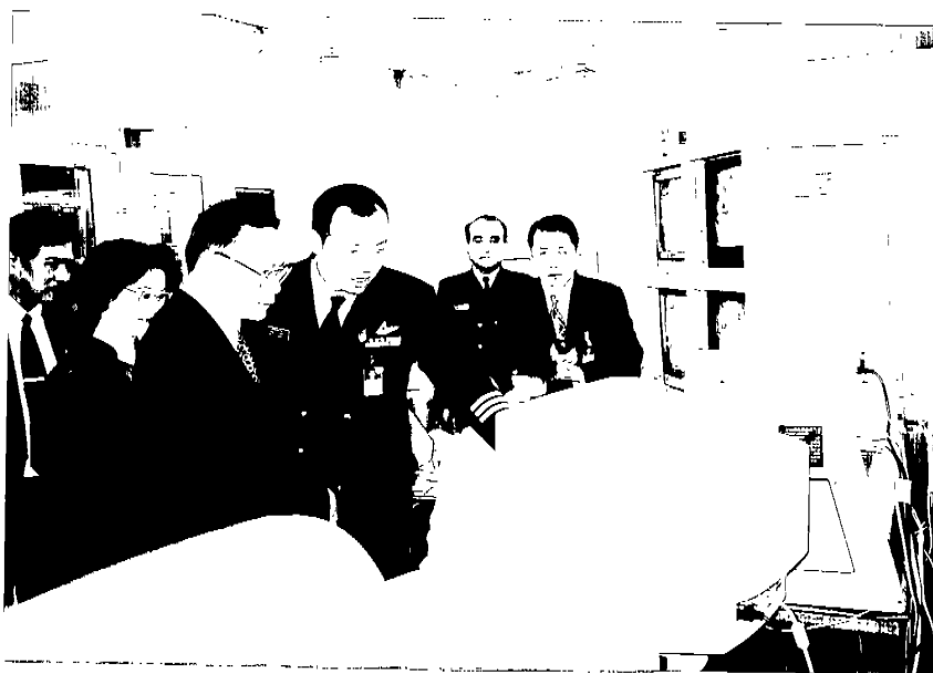
參觀泰國曼谷郎門機場證照查驗作業情形