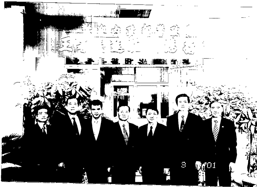
王署長及本署代表與我駐越南胡志明市代表處