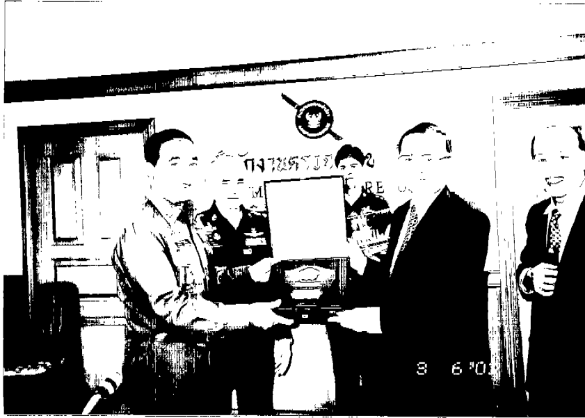
王署長致贈泰國移民局總局長