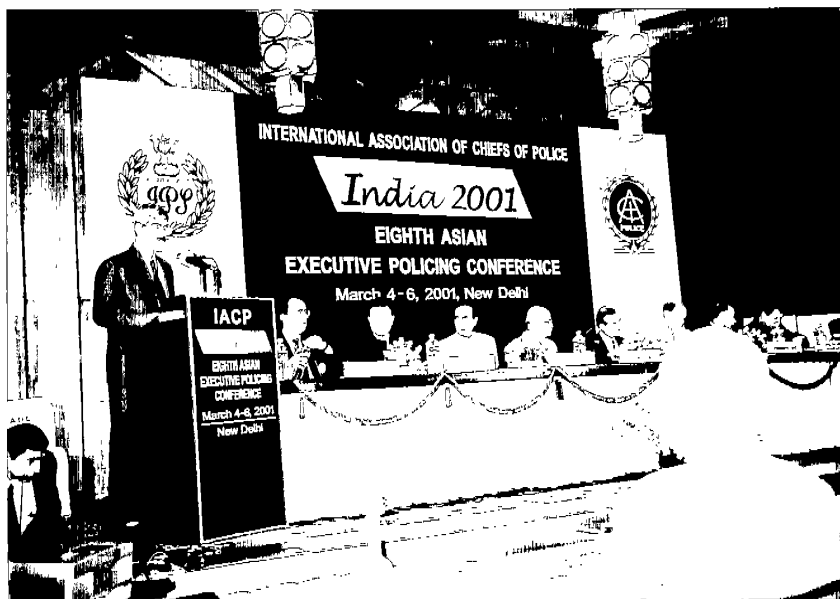
「國際警察首長協會」亞洲地區第八屆會議開會情形