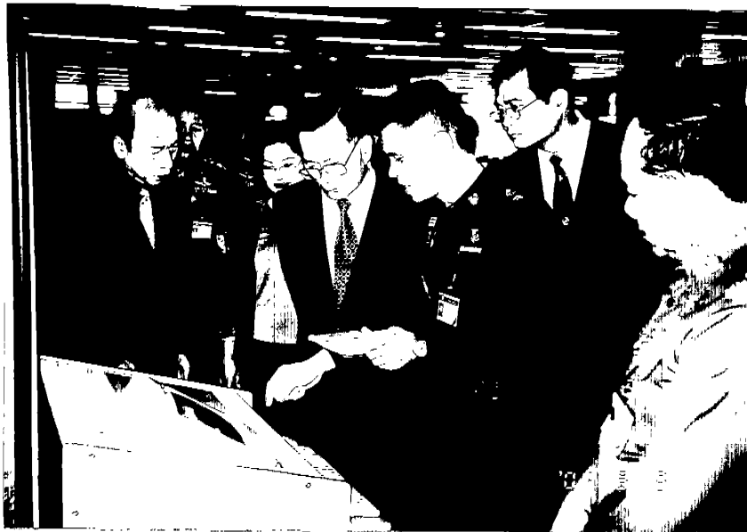
參觀泰國警官學校電腦資訊中心