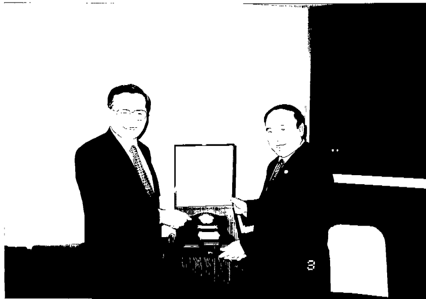
王署長致贈泰國警察總監 Pol. Gen. Pornsak Durongkavibulya