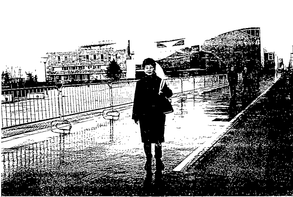
法國里昂國立高等師範學院