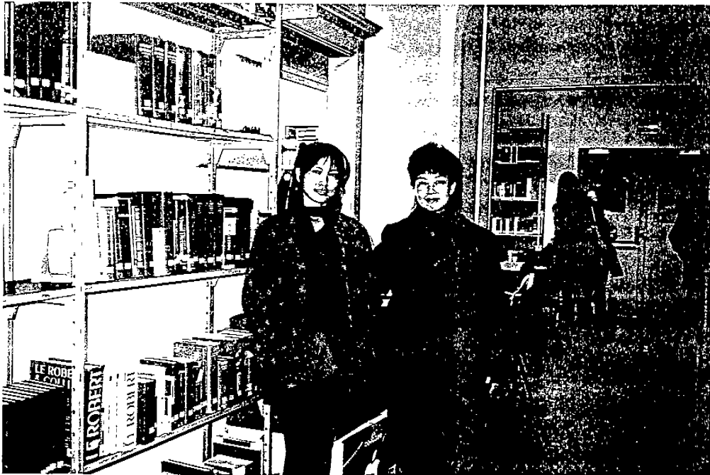
法國里昂東亞學院中文圖書館