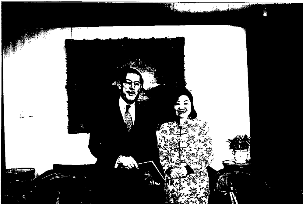
主委拜會大都會博物館館長 Philippe de Montebello