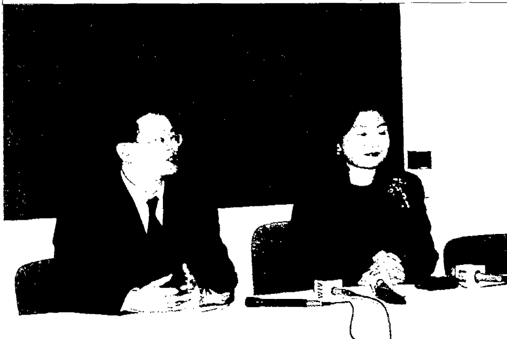
主委於紐文中心召開記者會現況