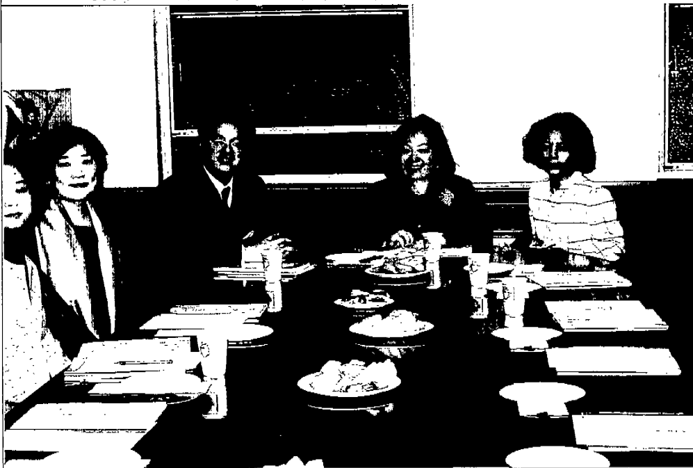
紐文中心同仁向主委簡報會議