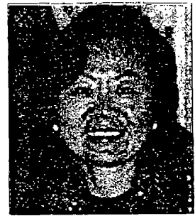
↑ 國府文建會主委陳郁秀，認為兩岸交流是最好方法。法的好。

【記者藍功中舊金山報導】國府行政院文化建設委員會主任委員陳郁秀六日在舊金山表示，文化不應受政治干預，兩岸交流不必擔心中國大陸的統戰，最好的應對方法就是開放。