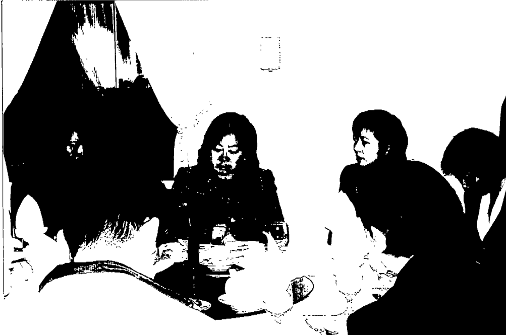
主委與灣區華文媒體座談