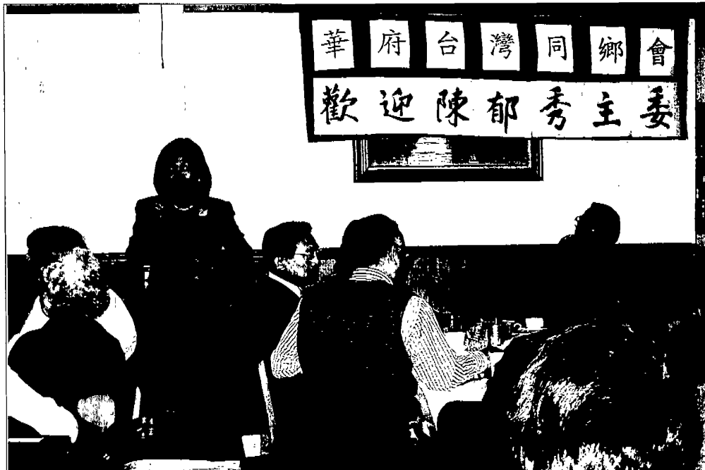
主委於華府台灣同鄉會歡迎晚會演講現況