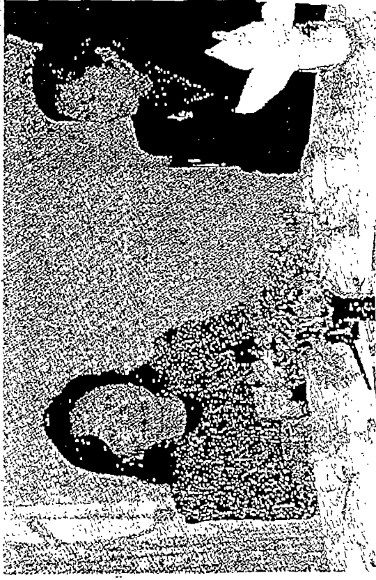
▲台灣行政院文建會主委陳郁秀介紹台灣的文化建設，身為新聞主任劉喬琦。

陳主委六日晚應邀在南灣文教中心以「文化台灣——台灣文化建設的過去、現在與未來」為題發表演說，其演說內容重點精述台灣文化建設未來的走向、政策與措施。分成事權的統一、改善文化環境、社區環境營造、文資保存、推動國際與兩岸文化交流等主題作出分析。