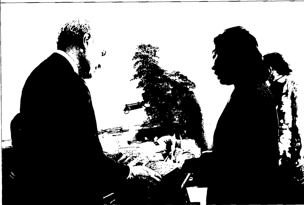
主委拜會林肯中心藝術節總監 Nigel Redden