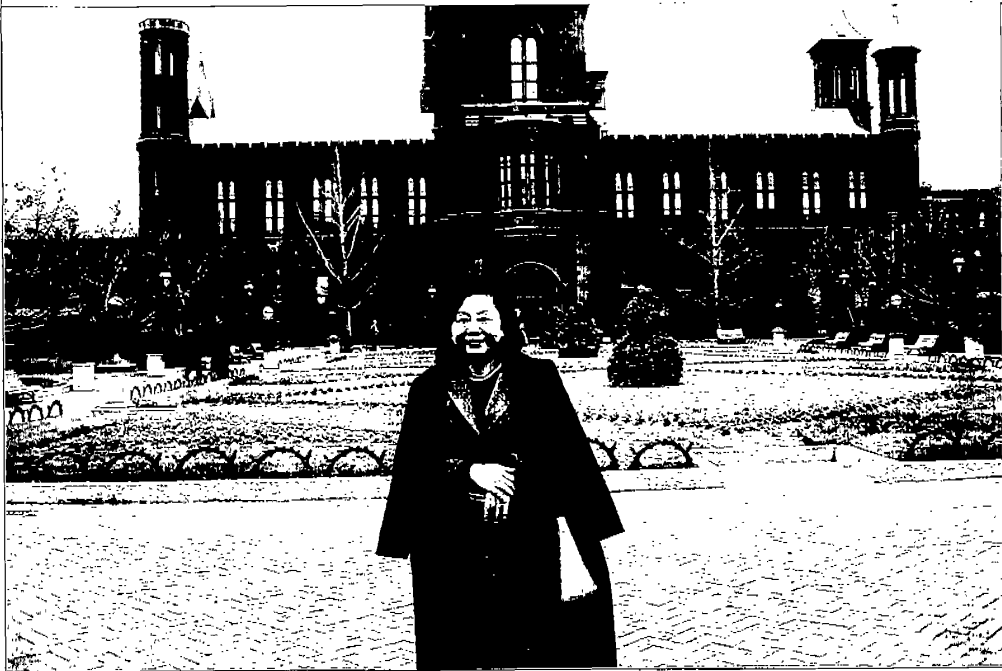
主委攝於 The Smithsonian Institution 外