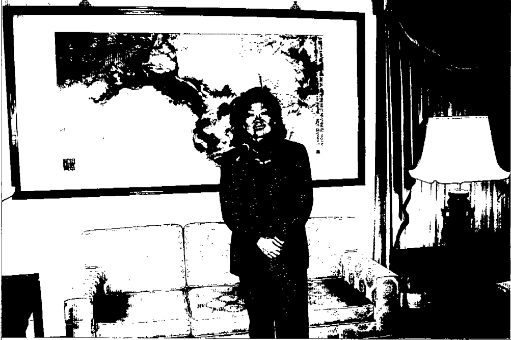
主委攝於雙橡園內