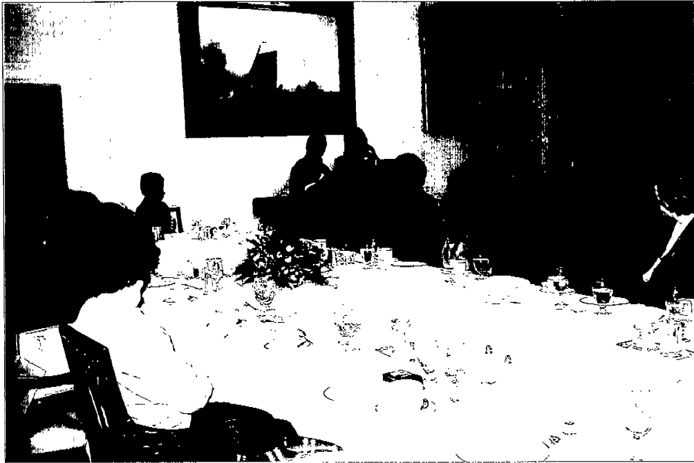
主委與紐約藝文界重要負責人餐會現況