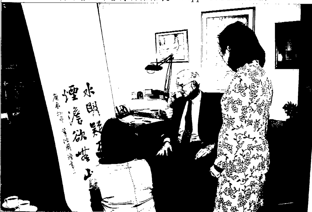
主委拜會亞洲協會總裁 Nicholas Platt