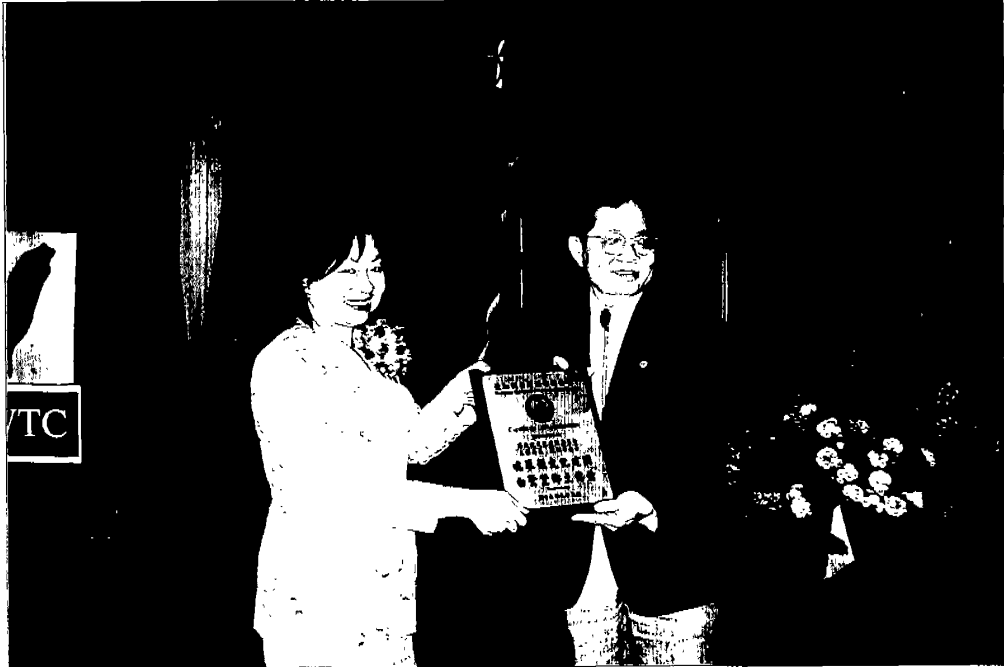
主委於北加州阿扁之友會演講後，接受該會之感謝