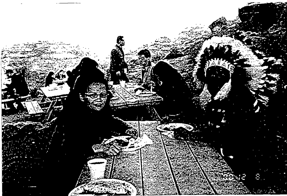
圖上：大峽谷印第安那原住民保留區之「原住民手工藝品展售中心」。 圖下：與印第安那原住民保留區之原住民共享當地原住民風味餐。