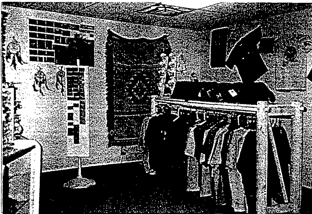
圖上、下：大峽谷印第安那原住民保留區之「原住民手工藝品展售中心」。