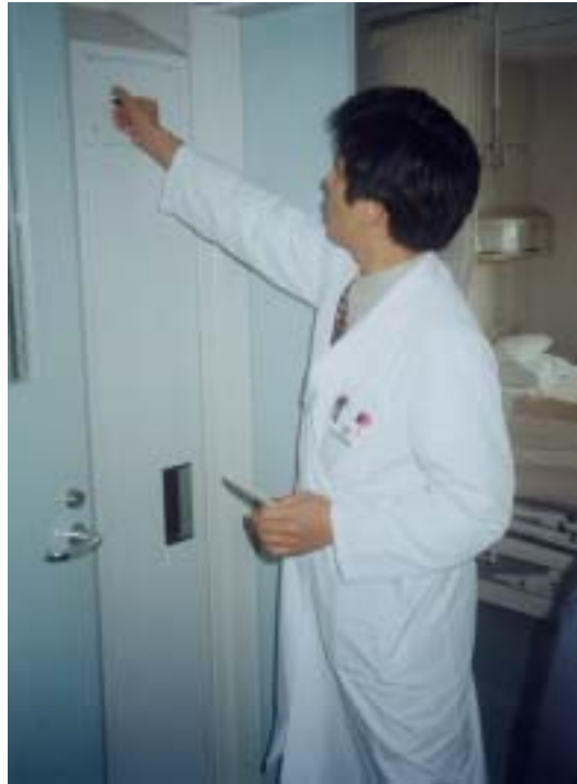
圖廿、紫外線消毒衣櫃