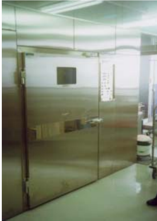
圖廿八、病床消毒機