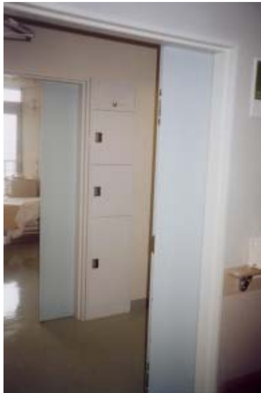
圖廿三、隔離病房（雙重門）