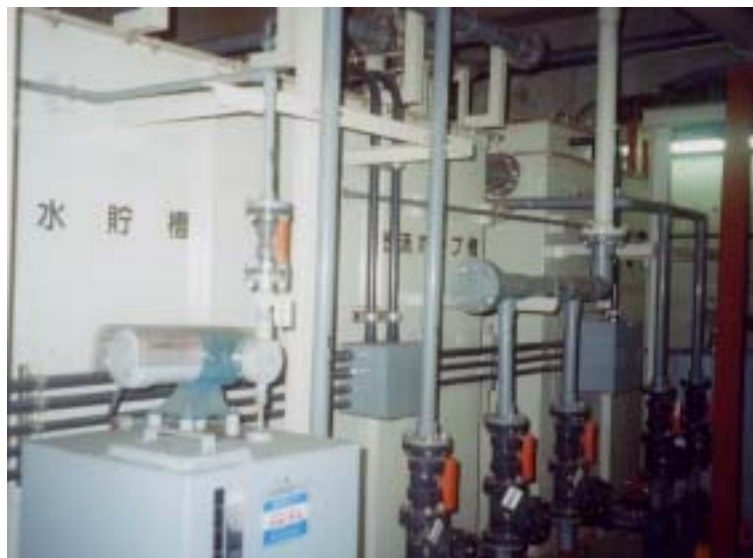
圖廿九、獨立污水處理系統