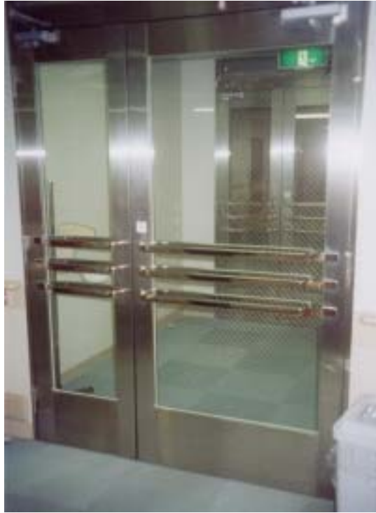
圖十八、傳染病病房（雙重門）