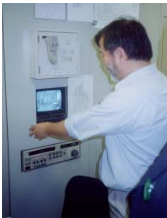
圖二、電視監控設施

拜訪完感染症情報中心後，轉往該所實驗室參觀，由該所生物安全部門介紹實驗室設備，屬於 P3 級實驗室，內部均有空氣負壓裝置及排氣管線過濾裝置，有監控窗及電視監控、對講機設施(圖二、三、四)，且置於建築物最底層，構築時亦將地震等天然災害因素考量；對工作人員的保護極為重視，要求極為嚴格，並定期辦理員工職前訓練；不過亦自我解嘲的表示 Level 4 的嚴重疾病，由於設於村山山分室之 P4 級實驗室受到當地民眾之抗，以致無法啟動運轉，議依規定目前並不能檢測，仍只能送到美國疾病管制局處理。