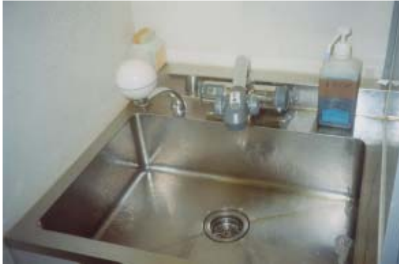
圖廿四、自動/手動洗手台