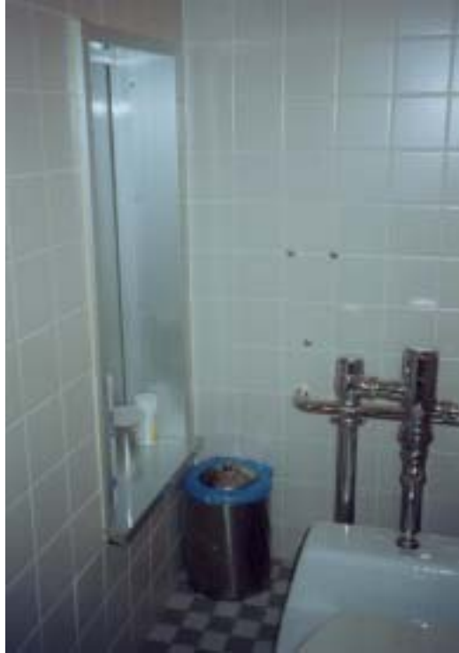
圖廿二、檢體送件孔