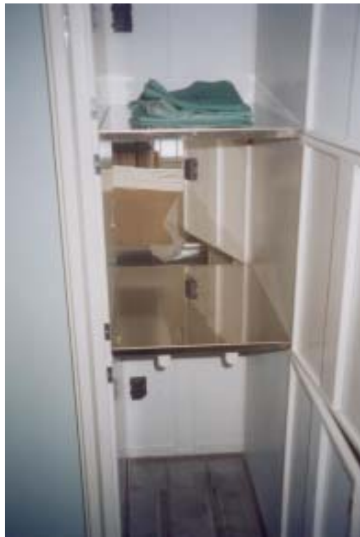
圖廿五、病患用品送取件櫃