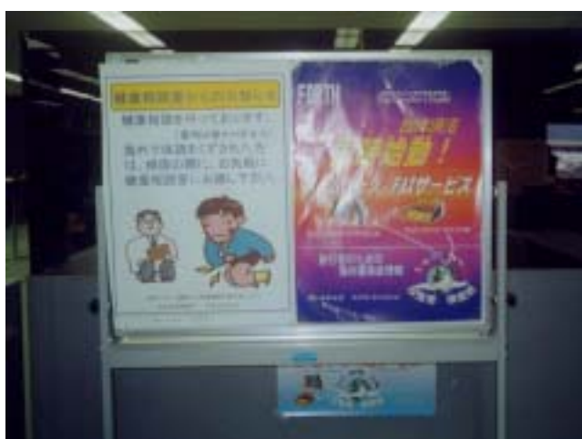
圖七、海外疫情海報