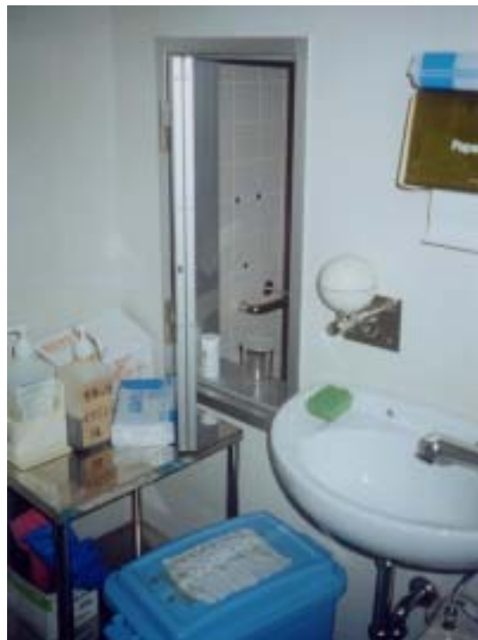
圖廿一、檢體取件孔