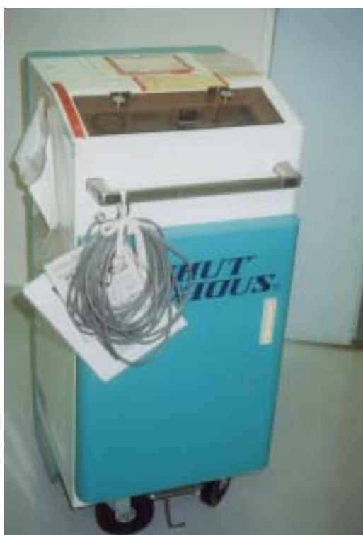
圖廿七、移動式病房消毒機