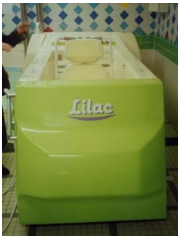
圖十七、輪椅浴缸（關）