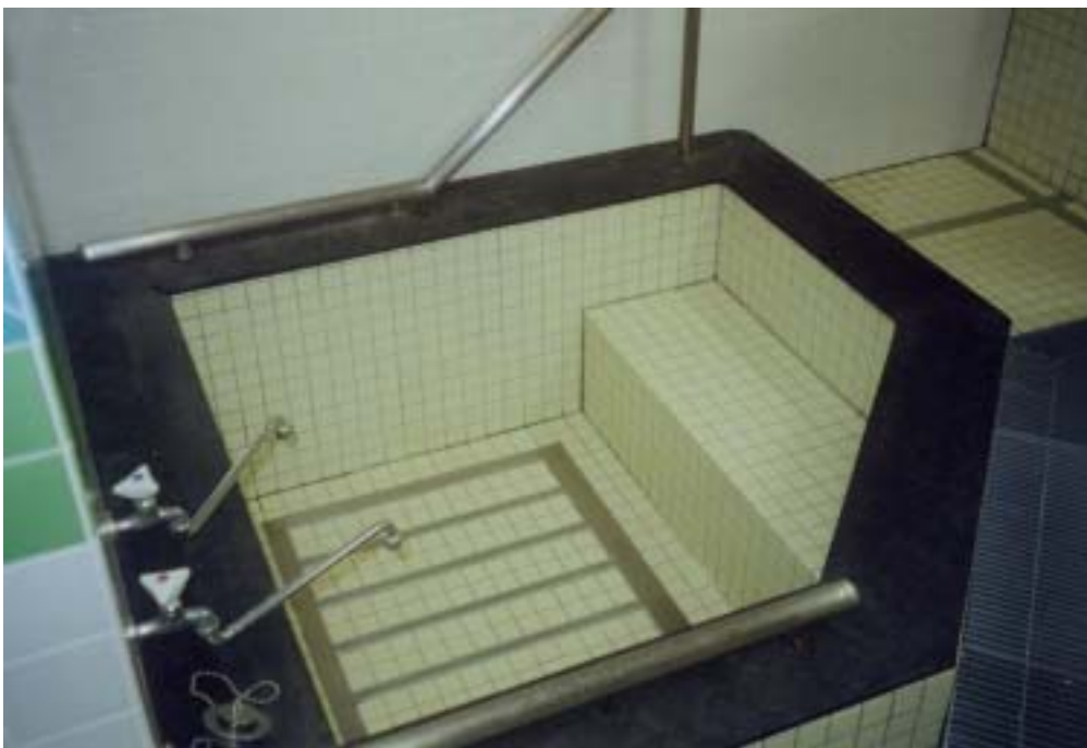
圖十五、可行動病人沐浴池

全自動沐浴設施，可將輪椅直接推入（如圖十五、十六、十七），病房設計頗具人性，並有改良式日本傳統格局及西式格局，病床外扶手及相關設施均極周全，居住園區的病患由政府補助，並可按期領用零用金，照顧可謂無微不至，難怪引導我們的研究中心主任也打趣說將來老了期望被收容。我國樂生療養院亦面臨病患高齡化之問題，現在又面臨捷運新莊線機房設置的問題，期待未來在整建或整體規劃時，可考慮日本良好的設計。