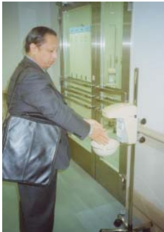
圖十九、自動手部消毒設施