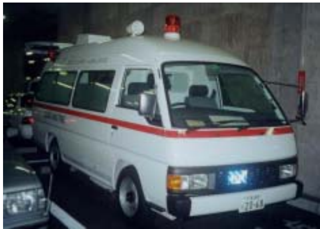
圖十三、檢疫救護車（外觀）