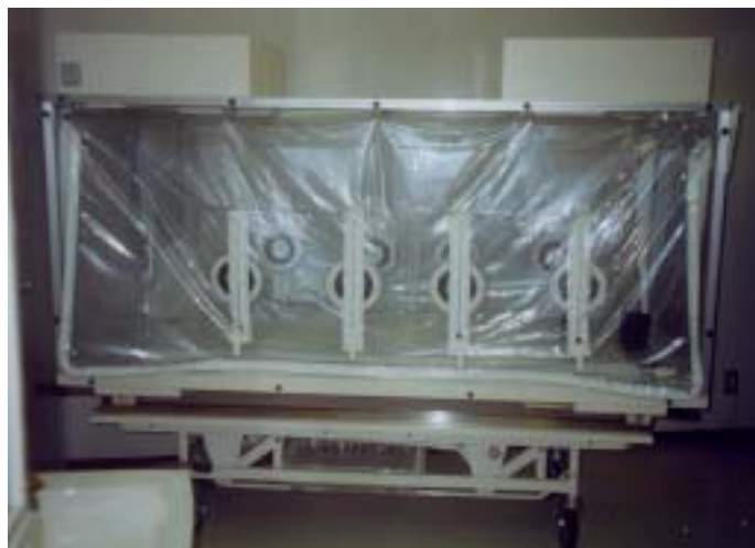
圖十一、呼吸道傳染病重症隔離床（正面）