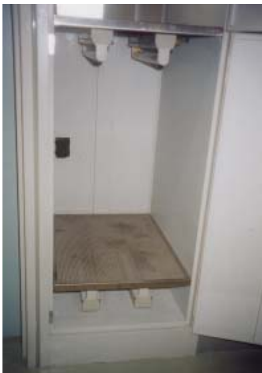
圖廿六、病患用品送取件櫃（紫外線消毒燈）