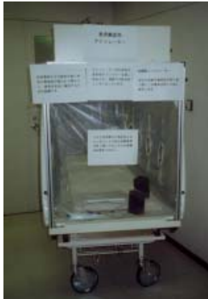
圖十二、呼吸道傳染病重症隔離床（側面）