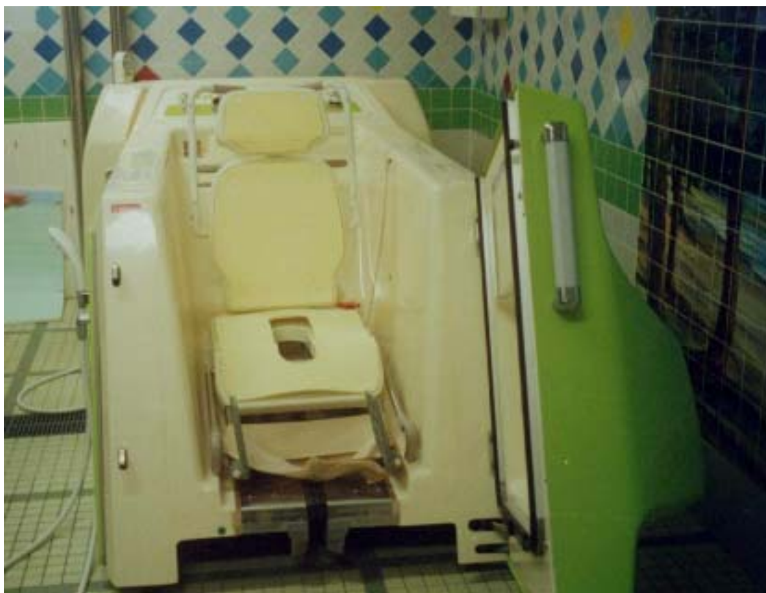
圖十六、輪椅浴缸（開）