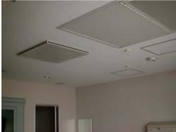
圖三十、病房負壓裝置