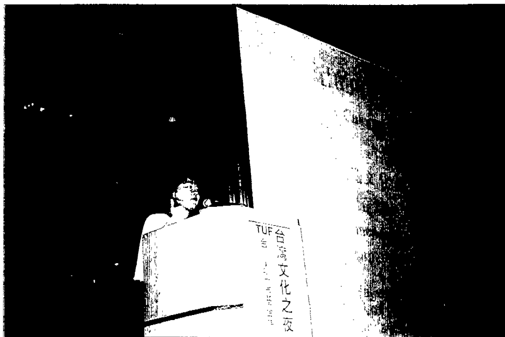
↓圖 2：發表「新世紀的台灣文化新願景」專題演講