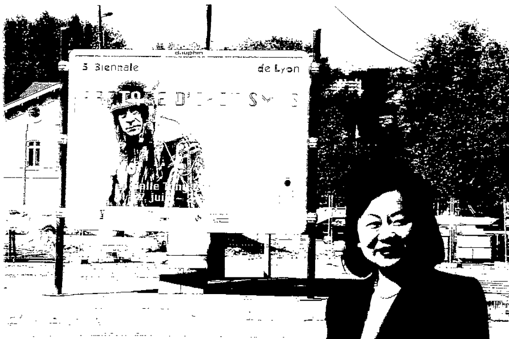
↓圖 16：參觀「第五屆里昂當代藝術雙年展」攝於展覽大型看板前