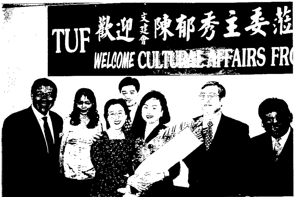
↑圖 1：應洛杉磯台灣人聯合基金會邀請於「台灣文化之夜」演講