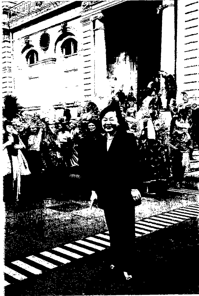
↑圖 19：里昂舞蹈節大遊行街頭一景