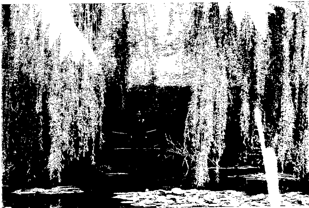
↓ 圖 8：參觀莫內紀念館莫內花園瞭解傳統建築再利用規劃執行情形