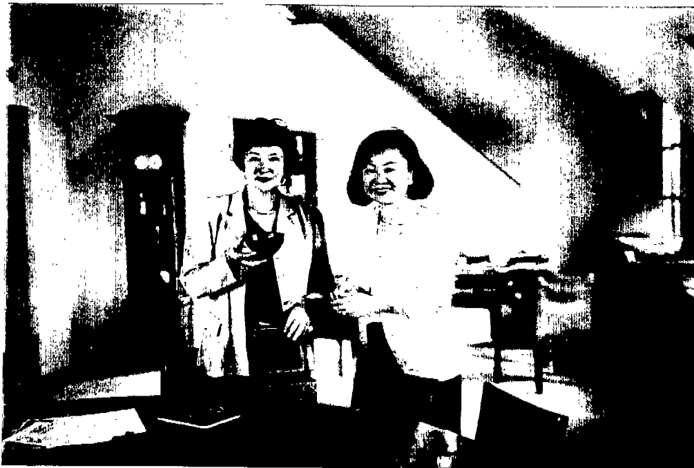
↑圖 5：拜會法國博物館聯盟主席 Mme. Françoise CACHIN