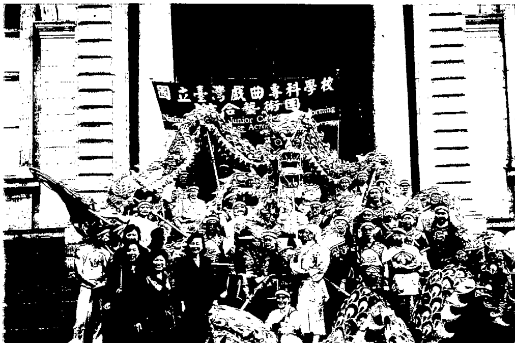
↓圖 18：與國立台灣戲專綜藝團團員合影