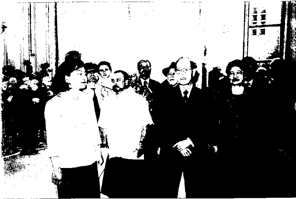
↑圖 9：與駐法郭代表為藩共同主持巴文中心「書法研究專題展」開幕酒會