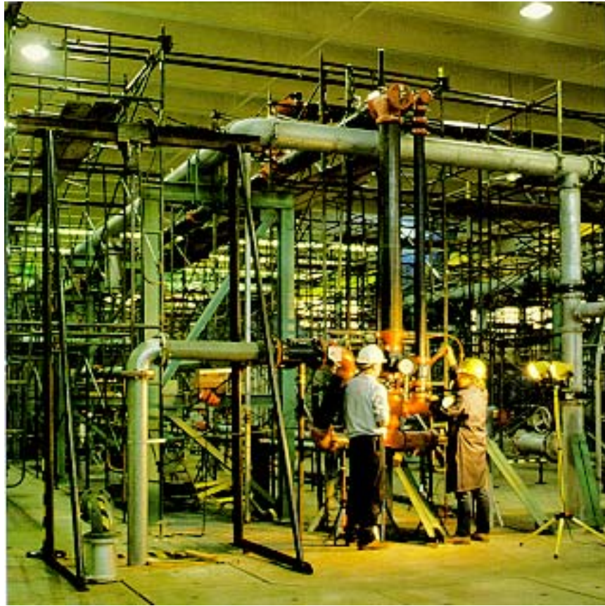
圖五、消防系統(全尺寸)測試

消防撒水系統在煉油廠及石化廠火災發生時，在防止災害之擴大上佔極為重要之地位，而中油公司油槽最常使用的型式為外浮頂油槽及錐頂油槽，僅將此次考察所得如何應用於消防撒水系統及此二種油槽消防上需考量之因素分述如下：