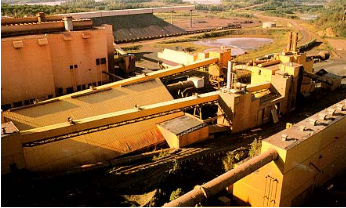
圖二 工程風險評估