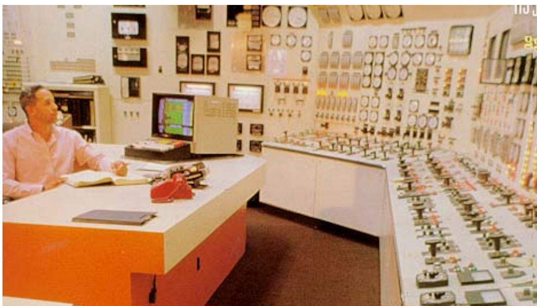
圖三 系統 RAM 工程

FM 研究中心之 RAM 服務，可使公司或工廠瞭解現場實際情況，同時顧及成本效益以改善生產實務。運用歷史紀錄資料建立實際情況模式之測試技術，使公司或工廠能更清楚瞭解整個生產系統運轉情況，需要時並可據以作進一步的改善。運用 RAM 技術可作整體設備的風險評估診斷，以下是幾個實例：