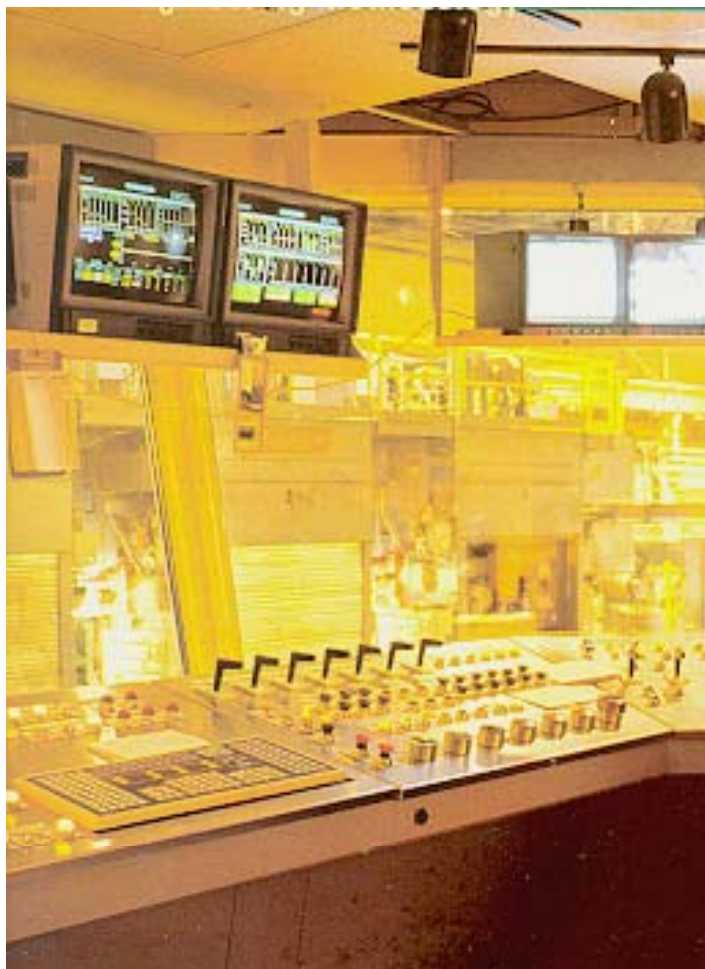
圖一 風險方法工程示意圖

風險方法工程之發展集中於不同領域的風險認知與風險量化等特殊技術之發展。與 FM 其他工作群組密切合作下，其成果顯現於現場實際的應用方面，諸如實用的檢測、評估、資訊收集及損害防阻技術等。其中尤以複雜工程系統的可靠度問題成效最佳，例如油、氣、水、電工程之安全防護系統。