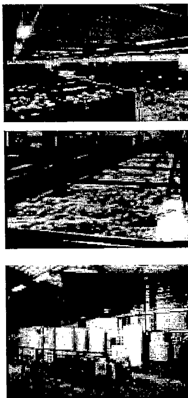
圖 1. 荷蘭百合種球之調製、儲藏系統 上：百合種球之採收、裝籃運送至調製場 中：自動覆蓋塑膠袋送交冷藏 下：ULO (Ultra Low Oxygen) 長期儲藏

最後莖葉從莖基部 10 公分上方切取、分級裝上塑膠袖套，放置於含些許水之容器中，2 至 3 °C 下儲放、包裝運往荷蘭如 Aalsmeer (VBA) 之拍賣場或外銷至全世界。